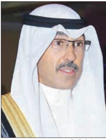
الشيخ فواز الخالد

هنا محافظ الأحمدى الشيخ فواز الخالد المملكة العربية السعودية قيادة وشعبا بمناسبة العيد الوطني الثامن والثمانين لتأسيس المملكة العزيزة والذي يحل اليوم الأحد الثالث والعشرين من سبتمبر وتمثل ذكراه واحدة من أهم وأعز المناسبات على قلوب الكويت الحبيبة وقيادتها الرشيدة وأهلها الطيبين على مدى الأجيال.