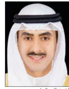
الشيخ ثامر الجابر

«رؤية 2030» تعزز التطلعات نحو مستقبل مشرق وآمن للمملكة