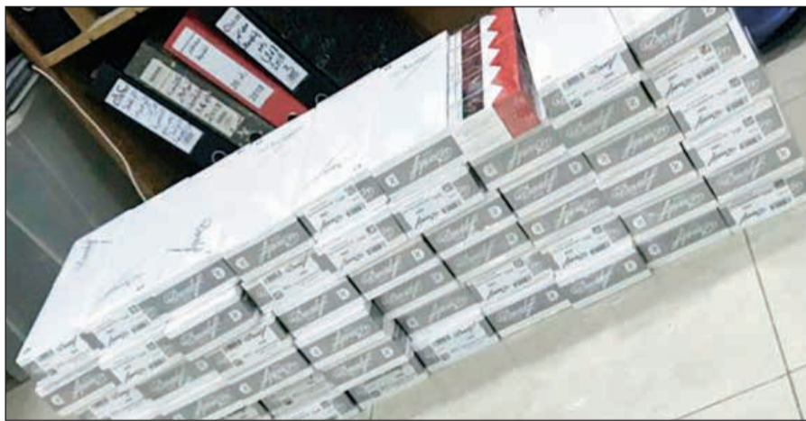
السجائر بعد ضبطها