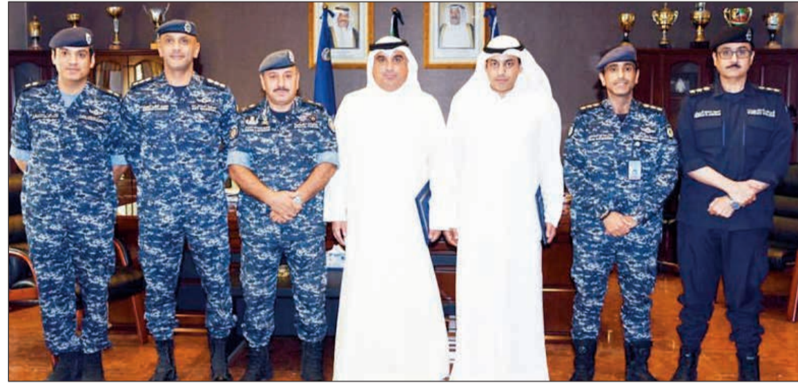
اللواء شكري النجار اثناء تكريمه المسعود والفارس

كرم وكيل وزارة الداخلية المساعد لشؤون الأمن الخاص بالإنابة اللواء شكري النجار سكرتير اول فهد المسعود ومنسق التشريعات خالد الفارس من وزارة الخارجية وذلك نظرا لجهودهما الحثيثة وتعاونهما الدائم في تسهيل مهام منتدبي ادارة حماسة الطائرات الكويتية في المحطات الخارجية.