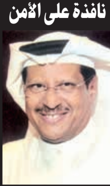
نافذة على الأمن