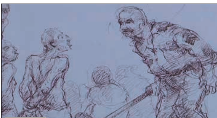
نجاح البقاعي وثق معاناته عبر رسوماته

رويترز: تبدو أشكال الشخصيات التي يرسمها الفنان السوري نجاح البقاعي، الذي يعيش في المنفى بباريس، وكأنها في حالة انكسار وشلل جراء ما يتفلق كاهلها من تعذيب وآلم وآيس. ويحيل البقاعي، وهو رسام كاريكاتير، الذكريات المزرعة، للتعذيب الذي يقول إنه مر به أثناء سجنه في معتقلات النظام السوري، إلى رسوم مفصلة للغاية ومشوشة في آن واحد، ومعظم رسوماته باللونين الأبيض والأسود مع خطوط ترتبط بالواقع الرهيب لكونه كان سجيناً في بلد مزقته حرب أهلية منذ سبع سنوات. وبالنسبة للبقاعي يعتبر الرسم نوعاً من العلاج. فالفنان، الذي أضحي أسيراً لتجربة السجن، لم يستطع رسم أي موضوع آخر منذ سنوات.