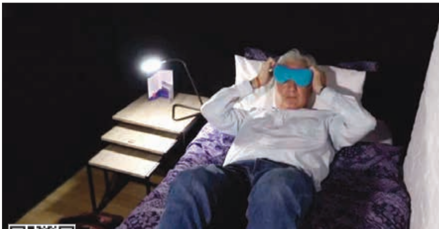
كبسولة النوم بديل عن استراحة تناول القهوة

أسس شايان مشروعا أطلقا عليه «زنا واسترح» وهو عبارة عن كبسولات للنوم تقدم قسطاً صغيراً من الراحة لسكان لندن، وسط جدول أعمال مزدحم، وقد استلهما الفكرة من فنادق الكبسولات في اليابان.