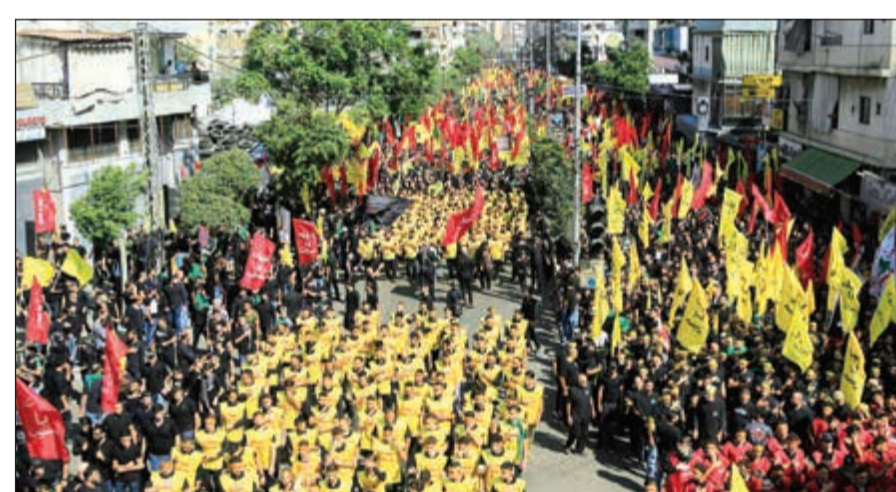
مسيرة شعبية في شوارع الضاحية الجنوبية بمناسبة ذكرى عاشوراء (محمود الطويل)

فرضت حرباً على لبنان، وأشار إلى أن «نقاط ضعف العدو الصهيوني أصبحت كثيرة وهو يعلم أن لدينا نقاط قوة كثيرة نمتلكها». واعتبر نصر الله أن «الإسرائيليين غاضبين لأن مشروعاتهم في المنطقة سسقط بعد أن علقوا آمالاً كبيرة على ما يجري في سورية والعراق لكن آمالهم ذهبت أراج الرياح». وأضاف «في الوقت نفسه علينا أن نكون دائماً على حذر لأن العدو الصهيوني لا أمان له مع أنه ينهب الدخول في أي معركة في المنطقة». وتابع «انتم تعرفون أن حزب الله أصبح أقوى، فالصهيوني كان يهدد باجتياح بيروت في السابق ولكن هذا الجيش الذي كان يهدد لم يعد موجوداً، وفي لبنان اختلفت المعادلة، وإن الله مد في عمري وانتم تسعون في الليل والنهار لقتلي ولكنكم فشلتم ووجودي تقوي دليل على فشلكم». ودعا نصر الله إلى «مواصلة التهذئة السياسية» في لبنان، مطالباً بـ «تشكيل الحكومة، وتفعيل المجلس النيابي وتحمل الجميع المسؤولية لتسيير كل الملفات»، وتطرق نصر الله إلى دعم إيران لحزبه، قائلاً «ببركة دعمها المتواصل»، استطاع الحزب أن يوجد «توازن الردع مع العدو الإسرائيلي». وقال إن الولايات المتحدة «تعمل على مدى الساعة وتذهب إلى كل عواصم العالم لتحاصر» إيران، مشدداً على أنه «من واجباتنا اليوم أن نقف إلى جانب إيران والتي بعد أسابيع قليلة ستدخل إلى استحقاق كبير وخطير وهو بدء تنفيذ العقوبات الأميركية».