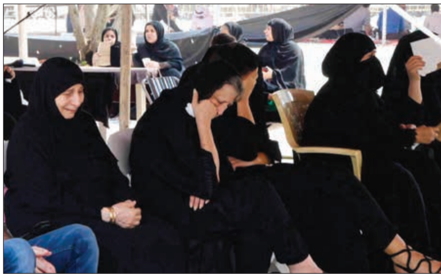
حضور نسائي في مجالس العزاء

الله وبالله وفي سبيل الله وعلى ملة رسول الله، ثم رفع رأسه إلى السماء، وقال: الهي إنك تعلم أنهم يقتلون رجلا ليس على وجه الأرض ابن بنت نبي غيره، ثم أخذ السهم وأخرجه، فوضع يده على الجرح فلما امتلأت دما رمى به إلى السماء، ثم وضع يده على الجرح، فثانيا فلما امتلأت لطخ به رأسه ولحيته وقال: هكذا أكون حتى ألقى جدي رسول الله وأنا مخضوب بدمي أقول: يا رسول الله قتلني فلان و فلان فعند ذلك طعنه صالح بن وهب على خصره طعنة، فسقط عن فرسه على خده الأيمن وهو يقول: بسم الله وبالله وفي سبيل الله وعلى ملة رسول الله، ثم جعل يجمع التراب تحت يده كالوسادة فيضع خده عليها ثم يتأجج ربه قائلا صبرا على قضائك وبلائك، يا رب لا معبود سواك، ثم وثب ليقوم للقتال فلم يقدر، فنأدى: وجداه و مصمصاه، وأبتاه و أبتاه و غربتاه و قلة ناصره، أقبلت مظلوما وجدي محمد المصطفى؟ أذبح عطاتنا وأبي علي المرتضى؟ أترك مهتوكا عمر بن سعد بأصحابه: وليكم أنزلوا وحزوا رأسه فأقبل عمرو بن الحجاج ليقتل الحسين فلما دنا ونظر إلى عينيه ولى راجعا مدبرا، فسأله عن رجوعه فقال: نظرت إلى عينيه كأنهما عيني رسول الله وأقبل شبت بن ربعي فارتعدت يده ورمى السيف هاربا، فعند ذلك أقبل شمر وجلس على صدر الحسين ووقعت المصيبة الكبرى التي يعجز القلم عن وصفها حيث حزن رأس سيد شباب أهل الجنة من الوريد إلى الوريد.