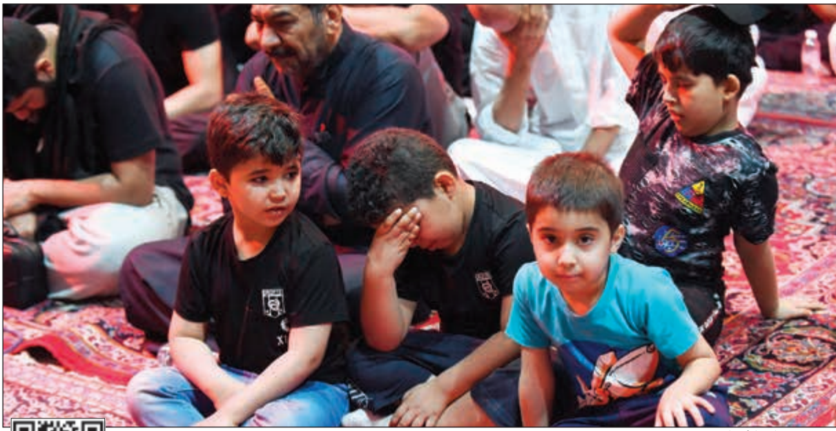
حضور من كل الأعمار