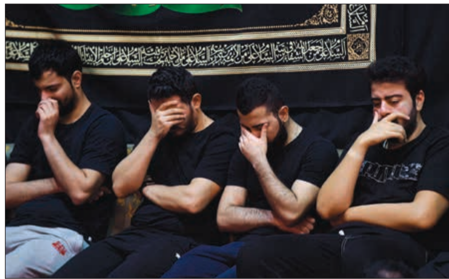
الحزن خيم على المعزين