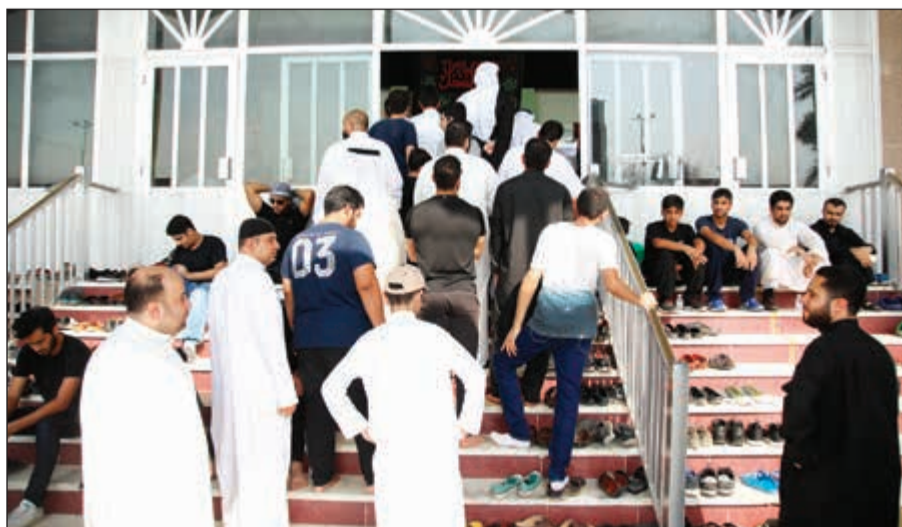
توافد المعزين على الحسينية العباسية

بفلسه، فلعمري هو كفو كريم، فتراجع القوم ثم بدأوا يرشقونه بالسهم والنبال حتى صار درعه كالفنذ، فوقف ليستريح ساعة وقد ضعف عن القتال، فبينما هو واقف إذ أتاه حجر فوقع على جبهته، فأخذ الثوب ليمسح الدم عن عينه فأتاه سهم محدد مسموم له ثلاث شعب فوقع السهم في صدره على قلبه، فقال الحسين: بسم