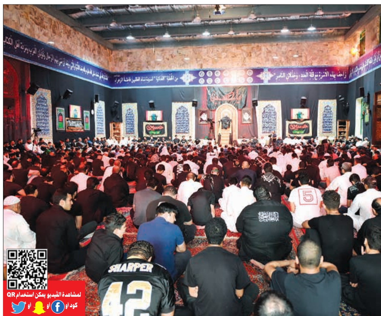
جاناب من مجلس العزاء في الحسينية الكربلائية صباح أمس (مستن غوزال)

أحيا آلاف المواطنين والمقيمين يوم العاشر من المحرم، واستذكروا مناقب سيد شباب أهل الجنة، وتطرقوا إلى مأساة فاجعة كربلاء وسط حزن وبكاء رواد الحسينيات على مصاب ريحانة رسول الله صلى الله عليه وآله وسلم. وبينما تضرع خطباء الحسينيات إلى المولى عز وجل أن يحفظ الكويت وقيادتها وأهلها والمقيمين فيها لاسيما في ظل التحديات التي تشهدها المنطقة، توجهوا بالشكر إلى رجال الداخلية على جهودهم في تأمين محاسن الذكر على مدى الأيام الماضية. في هذه الأثناء، أكد مصدر أمني مطلع أن الخطة التي وضعتها وزارة الداخلية لتأمين الحسينيات والمساجد حققت الهدف منها، لاسيما في ظل تعاون المواطنين والمقيمين، لافتاً إلى أن تلك الخطة شاركت فيها قطاعات الوزارة الميدانية وفي مقدمتها أمن الدولة والمرور والأمن العام والنجدة والأمن الخاص. وبمواكبة ذلك، كانت وزارة الصحّة على أهبة الاستعداد للتعامل مع أي طارئ وذلك بفضل التنسيق بين الطوارئ الطبية وأجهزة الداخلية وأصحاب الحسينيات. هذا، وبينما شهدت الجهات الحكومية نسبة غياب كبيرة أمس في ظل السماح للإخوة الشيعة بالعطلة، كان الغياب شبه جماعي لطلبة مدارس التربية، حيث سجلت نسبة الحضور في أغلب المدارس 70٪.