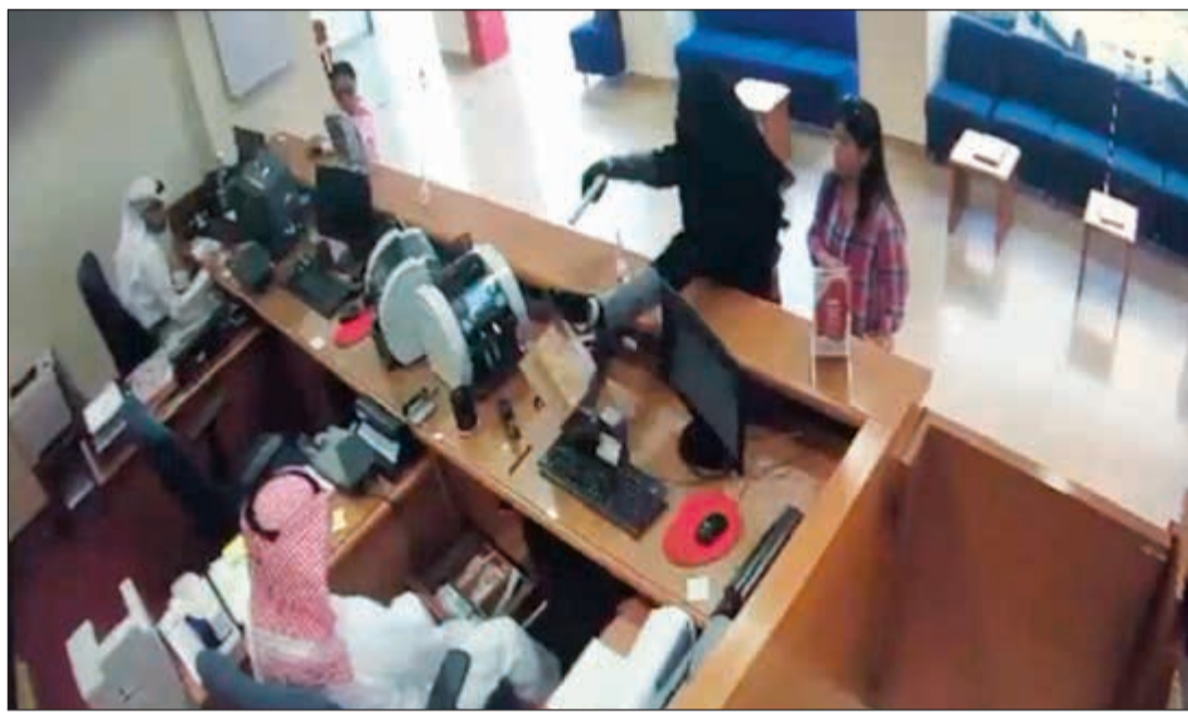
لقطة مأخوذة من مقطع مصور لعملية السطو على فرع بنك الخليج

أكد وزير الإعلام ووزير الدولة لشؤون الشباب محمد الجبري، أن الهيئة العامة لشؤون الزراعة والثروة السمكية قامت باتخاذ الإجراءات القانونية بشأن إلغاء تخصيص وسحب عدد من الحيازات الزراعية بمختلف الأنشطة (مشاتل - خدمات - أمن غذائي) وتحويل الحيازات المخالفة والمتعدية على أملاك الدولة إلى الجهات المختصة لاتخاذ اللازم حيالها. وأشار الجبري في بيان أمس إلى أن الهيئة قامت بوضع آلية جديدة لتنفيذ التوصيات لجنة الميزانيات والحساب الختامي بمجلس الأمة بمحاربة سوق الأعلاف السوداء، وذلك بتطبيق تسلم دعم الأعلاف من قبل صاحب العلاقة شخصياً أو من ينوب عنه قانونياً من الدرجة الأولى. وأوضح أنه جار