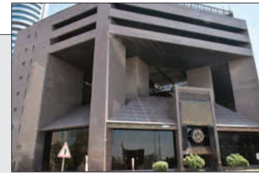
سيولة قياسية لبورصة الكويت أمس قبل الترقية إلى مؤشر فوتسي

«نفط الكويت»: نقل وترقية 6 مديريين و20 رئيس فريقي 16