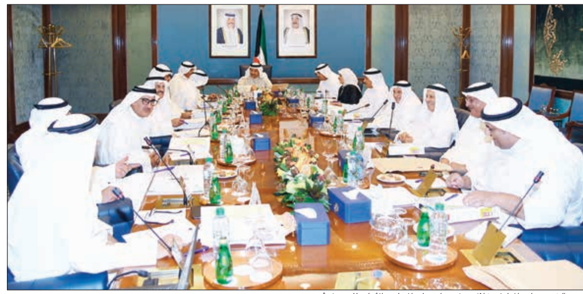
سمو الشيخ جابر المبارك خلال ترؤسه اجتماع المجلس الأعلى للبترول أمس

وذلك تمهيدا لتغيير المشروع بالكامل وتغيير معه الوحدات التكريرية وكميات الإنتاج للوحدات ومن ثم تحوّل المصفاة لاحقا الى مصفاة تحويلية. وكانت «الأنباء» قد انفردت في تاريخ 22 يوليو الماضي تحت عنوان «الكهرباء تترك مصفاة الزور.. لن نحناج إلى كل منتجات المصفاة»، حيث تم تغيير متطلبات وزارة الكهرباء والماء والتي سيتم من خلالها الاستغناء عن كميات ضخمة من منتج زيت الوقود الذي تم تشييد المصفاة في الأساس لتوفيره لمحطات الكهرباء والماء لتشغيل التوربينات. وبينت المصادر ان المصفاة يتم تشييدها لتوفر إمدادا ثابتا لمحطات الطاقة بنحو 225 ألف برميل يوميا من زيت الوقود البيئي، وإنتاج ما يقارب 340 ألف برميل يوميا من المنتجات البترولية العالية الجودة. وأشارت الى ان متطلبات وزارة الكهرباء والماء من منتج زيت الوقود انخفض، خصوصا مع تزايد إنتاج الكويت من الغاز الحر والذي وصل الى مستويات تاريخية