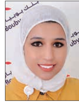
في مجبل المطوع

والذي يجدون صعوبة في الحصول على التعليم المناسب بسبب قدراتهم المالية الضعيفة». وأوضحت في المطوع أن بنك بويان يسعى من خلال هذه الفعاليات والأنشطة إلى المساهمة في خدمة