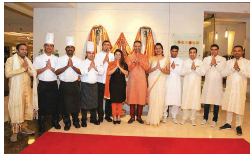
طاقم عمل الفندق

هذا، وقد تم إطلاق نكهات من الهند... الأمسية الهندية بحضور الأسرة الصحافية والإعلامية وذلك تقديراً لجهودهم وتعاونهم البناء وكشريك دائم للفندق، بالإضافة إلى اصداق وزلاء الفندق وطاقم إدارة شركة سفير للفنادق والمنتجعات الذين استمتعوا بتفاصيل الأمسية الهندية وأجوائها الفريدة.