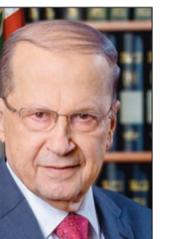
الرئيس اللبناني العماد ميشال عون

الإشائية الكبيرة والعديدة التي نفذها صندوق التنمية في جميع المناطق اللبنانية وعلى مدى عشرات السنين. وشهدت الدائرة في بيان لها على أن كل هذا التاريخ الأخوي بين لبنان والكويت لا يبادل بهذا الشكل، خصوصا أنه ليس من شديدا كلبانين ان نرد على علاقات الصداقة والأخوة في محاولة تشويه صورة من قدم للبنان من دون مئة ومقابل، وتؤكد أخيرا على عمق العلاقة التي تجمع لبنان والكويت والشعبين اللبناني والكويتي، وتطالب القضاء اللبناني بالتخاذ الإجراءات المناسبة لكي لا تتكرر هذه الواقعة.