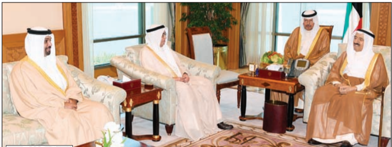
صاحب السمو الأمير الشيخ صباح الأحمد مستقبلاً سمو الشيخ محمد بن مبارك آل خليفة والوفد المرافق