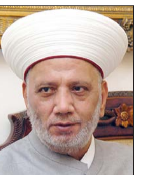
المفتي عبد اللطيف دريان