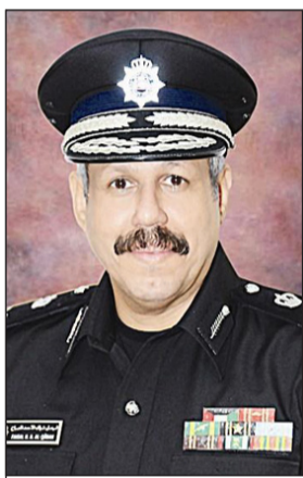
الوزراء الشيخ فيصل النواف

أعلن مقرر لجنة تحسين بيئة الأعمال النائب يوسف الفضالة عن نية المؤسسة العامة للرعاية السكنية تخصيص ما يقارب 150 ألف متر مربع لمباردي الصندوق الوطني لتنمية المشروعات الصغيرة والمتوسطة.