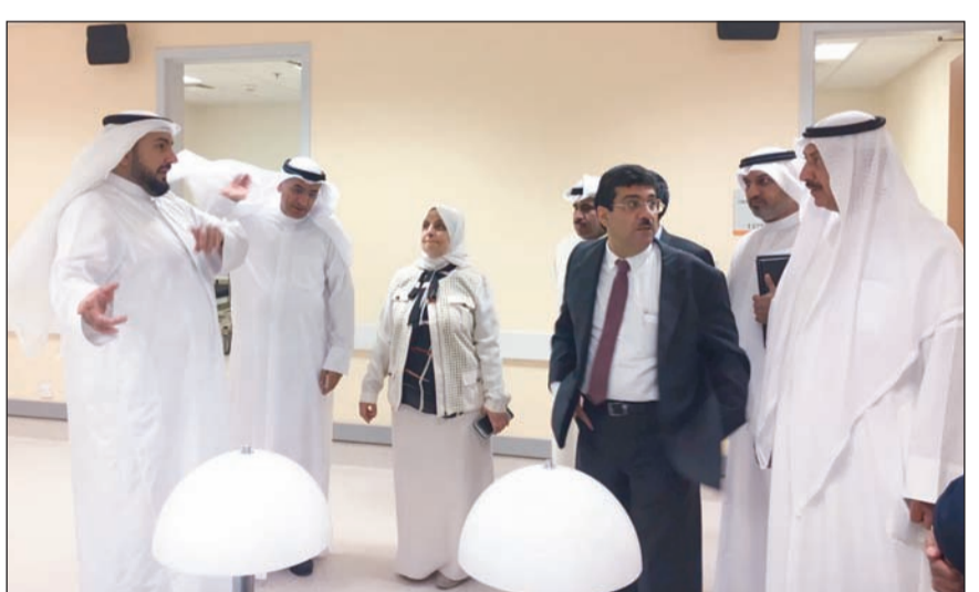
الوزراء الشيخ ديباسل الصباح وهند الصبح وبخيت الرشيد وم.حسام الرومي ودمصطفى رضا خلال الجولة

تعرفوا على ما أثير من ملاحظات مختلفة سواء كانت إنشائية أو فنية أو إدارية قد تعيق الجدول الزمني المتفق عليه