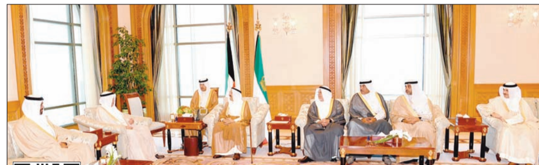
صاحب السمو الأمير الشيخ صباح الأحمد خلال استقباله الشيخ صباح خالد ونائب رئيس مجلس الوزراء بمملكة البحرين سمو الشيخ محمد بن مبارك آل خليفة بحضور الشيخ علي الجراح والشيخ محمد العبد الله والشيخ خالد العبد الله

بعدد مجلس الوزراء جلسته الاعتيادية اليوم للنظر في عدة ملفات لعل أهمها التلويج باستجواب بعض الوزراء. في هذا الصدد، قالت مصادر وزارية في تصريحات خاصة لـ «الأنباء» ان الحكومة تمد دائماً يد التعاون «نحن نسعى دائماً لتعاون حقيقي بكل الأدوات والطرق والسبل القانونية الممكنة». وردا على سؤال حول الطلب من سمو رئيس مجلس الوزراء الشيخ جابر المبارك تخفيض سعر قسائم خيطان الجنوبي، أجازت المصادر: ان كل الطلبات والمقترحات تدرس