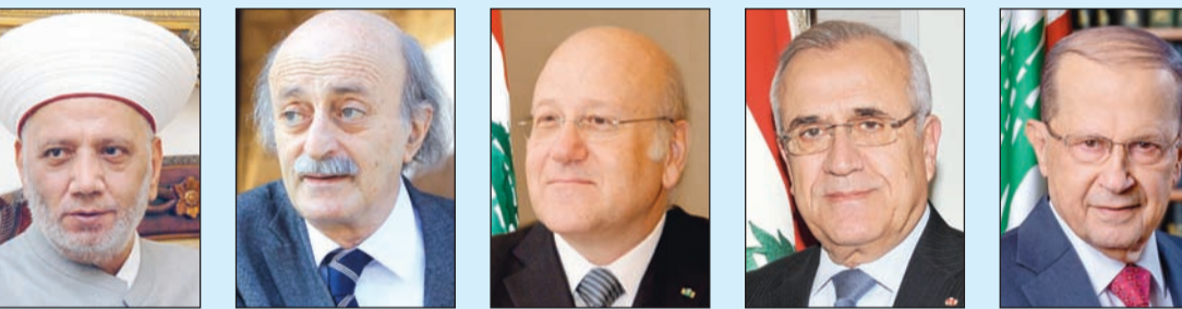
الرئيس ميشال عون، الرئيس ميشال سليمان، نجيب ميقاتي، وليد جنبلاط، المفتي عبد اللطيف دريان