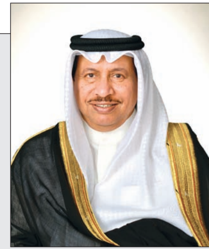
سمو رئيس الوزراء الشيخ جابر المبارك

رئيس الوزراء يرعى "ملتقى التعليم ومواءمته مع سوق العمل" بداية العام المقبل 03