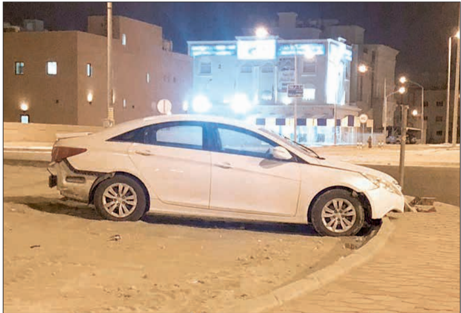
المركبة في دوار جابر الأحمد

ومن جانب آخر، وخلال تجوال دورية تابعة لقطاع مرور الاحمدي تم رصد مركبة رياضية مخالفة لقانون المرور فتم استيقاف قائدها، وبلاستعلام عن المركبة تبين انها مسجل بحقها (حجز قضائي) وعلى ذلك تمت احالة المركبة لمخفر ابو حليفة لاتخاذ الاجراء اللازم عن طريق دوريات المرور.