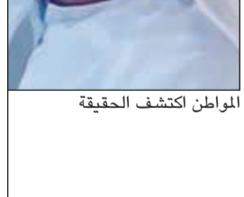
المواطن اكتشف الحقيقة

التي رصدتها التقرير الطبي. وكان المواطن قد أثار ضجة إعلامية كبيرة من خلال مقطع فيديو تم بثه على مواقع التواصل وادعى فيه قيام 13 رجل شرطة بالاعتداء على ابنه بسبب مخالفة مرورية، مؤكدا اعتزازه باختصاص «الداخلية»، قضائيا من خلال شكوى الى النيابة.