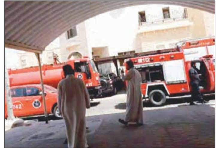
أليات الإطفاء أمام منزل سعد العبدالله

غرفة عمليات الداخلية عن اشتعال النيران بمنزل في منطقة سعد العبدالله، وعلى الفور انتقل رجال الإطفاء الى الموقع وتبين ان المنزل خال من السكان، حيث تمت السيطرة على الحريق الذي اقتصر على الخسائر المادية.