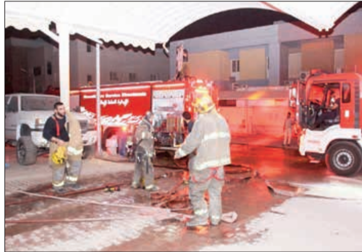
رجال الإطفاء أثناء التعامل مع حريق المحول