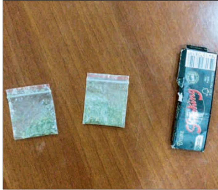
اكياس الكيميكال التي ضبطت بحوزة الباكستاني