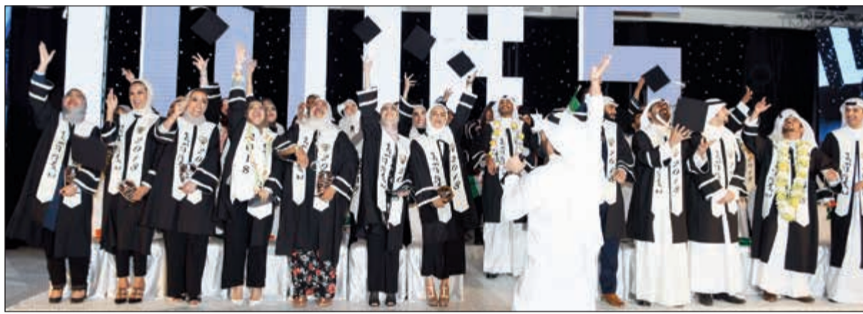
فرحة الخريجين والخريجات بالتفوق والتكريم