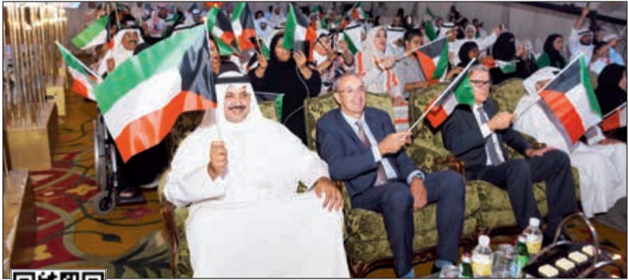
الشيخ مبارك العبدالله والسفير البريطاني مايكل دافنبورت خلال الحفل

أقامت كلية التربية بجامعة الكويت لقاءها التنويري لطلبة الدراسات العليا للعام الجامعي 2018/2019، وذلك بحضور العميد المساعد للشؤون الأكاديمية والدراسات العليا أ.د. فوزية هادي ومدير برنامج الماجستير لقسم أصول التربية د. جيلاني بوحمامة. وأكدت العميد المساعد للشؤون الأكاديمية والدراسات العليا أ.د. فوزية هادي على أهمية عقد مثل هذه اللقاءات وقدمت شرحاً وافياً عن النماذج والإجراءات التي يجب أن يتبعها طالب الماجستير عن خطوات التسجيل، مشيرة إلى بعض تجاربها مع الدارسين لاسيما فيما يخص لجوء بعض الطلبة الدارسين لنسخ أطروحة الماجستير من الإنترنت، مؤكدة على ضرورة الالتزام بالتعليمات من قبل المشرف على الأطروحة وضرورة الالتزام ببرنامج كلية الدراسات العليا.