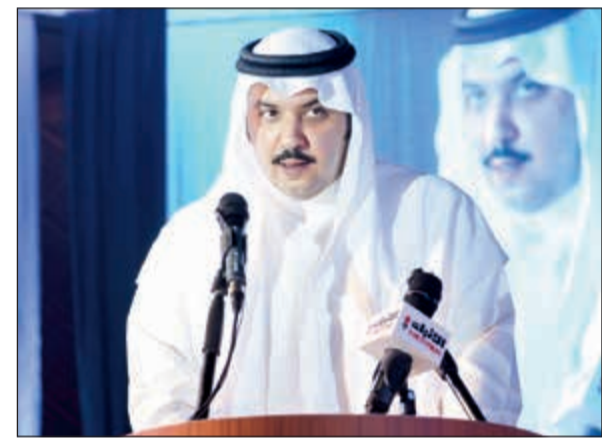
الشيخ مبارك العبدالله متحدثاً خلال الحفل