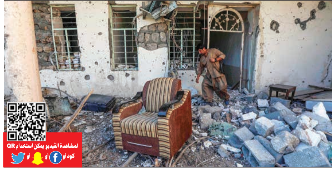
عمر من البيشمركة الإيرانية يتفحص الدمار الذي لحقه القصف الإيراني على مقر قيادة «الحزب الديمقراطي الكردستاني الإيراني» في كردستان العراق