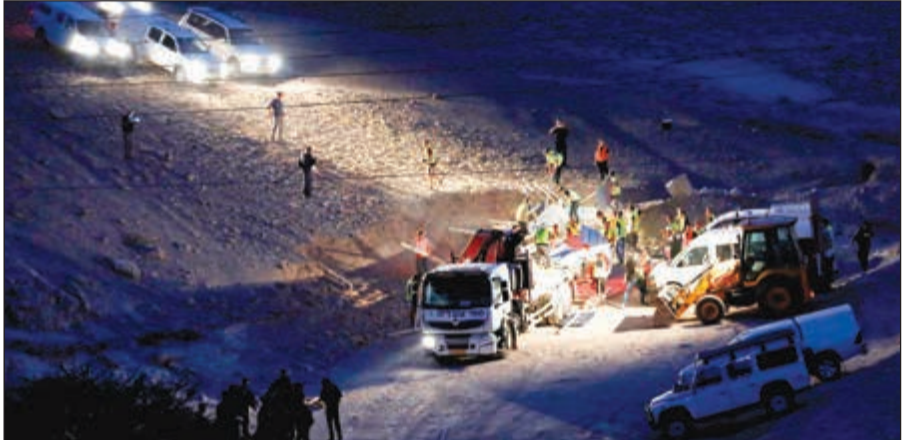
قوات الاحتلال تدمر المنازل المؤقتة التي أقامها ناشطون قرب «الخان الأحمر»