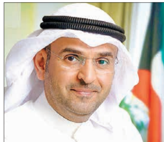
وزير المالية د. نايف الحجرف

وأضاف: «لجميع دور أساسي في التحكم بمصرفات الدولة، وللوزارة دور توجيهي وإرشادي ورقابي على الجهات. نحن نضع الأطر والاستراتيجية المالية العامة للدولة ومتابعة تنفيذ الأداء المالي بكل تفاصيله، وإصدار تعليمات لمعالجة مواطن الخلل في الميزانية، ونحن فريق واحد في تنفيذ هذه الاستراتيجية والتعليمات والتي يجب أن تتبّع، والجهات التي لن