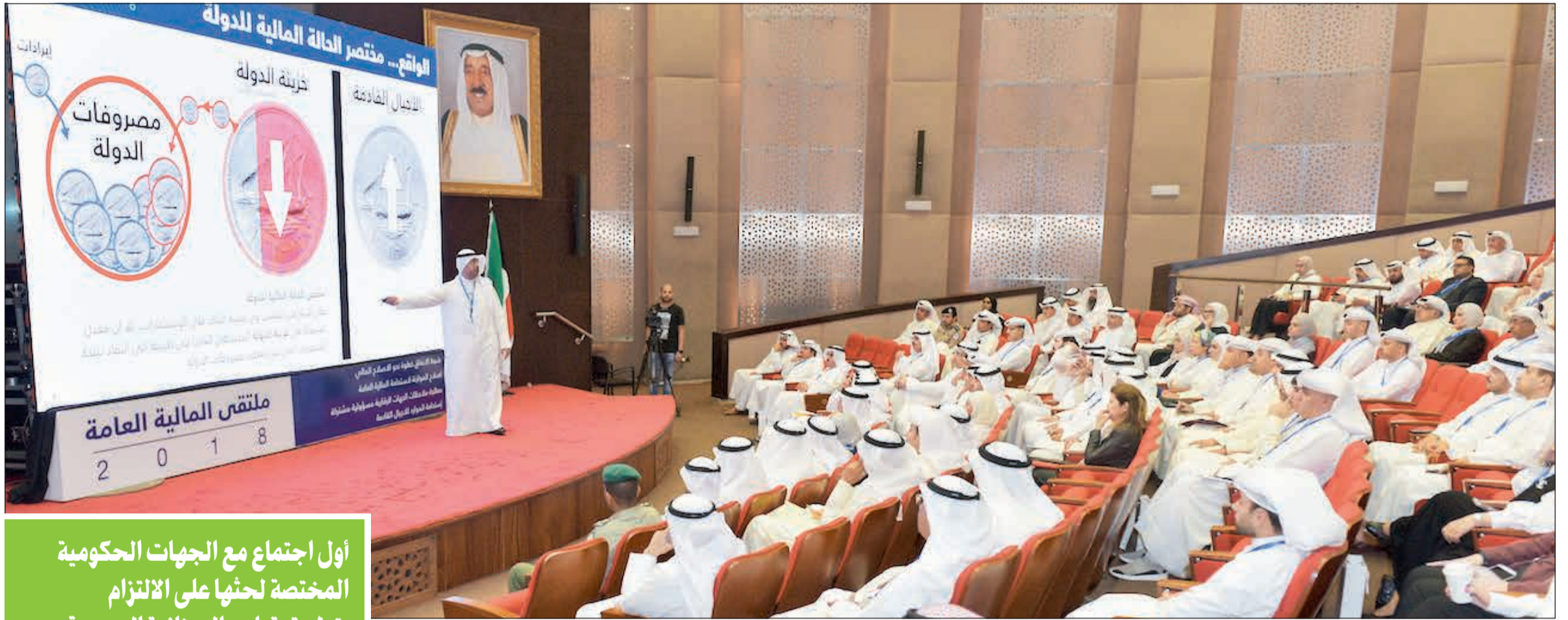
د. نايف الحجرف يستعرض النهج الجديد في إعداد ميزانية الدولة

أول اجتماع مع الجهات الحكومية المختصة لحثها على الالتزام بتطبيق قواعد الميزانية الجديدة