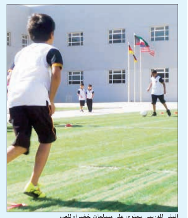
المبنى المدرسي يحتوي على مساحات خضراء للعب

حصلت المدرسة الأميركية الألمانية على شهادة الأيزو في جودة التعليم، وذلك عن خدماتها المتميزة تعليمياً والتي طبقت المعايير الدولية. وبهذه المناسبة، صرحت إدارة المدرسة بأنها فخورة بهذا الإنجاز الذي يؤكد إصرارنا على الوصول إلى أعلى المستويات أكاديمياً وعلى مستوى كل القطاعات الأخرى، من خلال الكادر التدريسي الأميركي والألماني المميزين، بالإضافة لامتلاكنا واحداً من أحدث المباني المدرسية داخل الكويت، حيث يحتوي المبنى المدرسي على مساحات خضراء للعب وحمام سباحة وسينما ومختبرات متنوعة، بالإضافة إلى الفصول الذكية المجهزة حسب أعلى المعايير الدولية. كما أشارت إدارة المدرسة إلى أنها مستمرة بتسجيل الطلاب الراغبين في الالتحاق بها وحتى شهر أكتوبر المقبل.