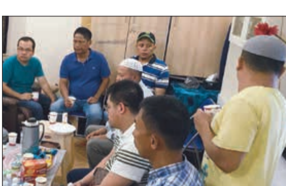
مشاركة من السفارة الفلبينية في العزاء