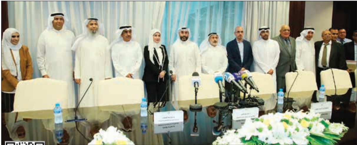
الوزيرة دجنان بوشهري خلال توقيع العقود بحضور المدير العام ونوابه

يمكن استخدام QR كود أو التواصل عبر وسائل التواصل الاجتماعي