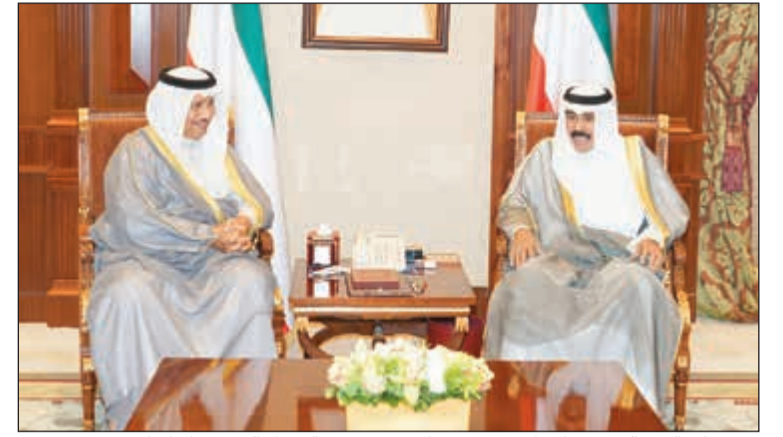
سمو ولي العهد الشيخ نواف الأحمد مستقبلاً رئيس الوزراء الشيخ جابر المبارك

الإدارة الجديدة. حضر المقابلة رئيس ديوان سمو ولي العهد، الشيخ مبارك الفخيل. كما استقبل سمو ولي العهد الشيخ نواف الأحمد بقصر بيان صباح