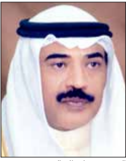
الشيخ صباح الخالد

وتقدم مستمر في مختلف المجالات، مثنياً للجهود الفاعلة للإدارة الأميركية في إرساء آليات التعاون المشترك بين البلدين الصديقين.