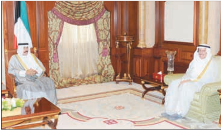
سمو ولي العهد مستقبلاً السفير الشيخ عزام الصباح