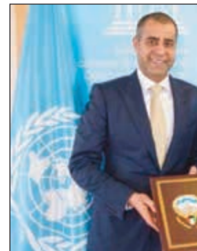
مدنويتا لدى اليونسكو السفير آدم الملا والمديرة العامة لليونسكو أودري ازولاي

الجديدة. وأوضحت أن هذا التعاون التاريخي توج في مرحلة أزمة اللاجئين السوريين بتعاون لتنفيذ عدد من مشاريع تعليم اللاجئين السوريين في لبنان والأردن. وأقصدت عن اتفاقية جديدة سيتم توقيعها مع اليونسكو في لبنان لاعاد