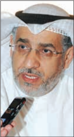
عبدالله سرور المطيري

القاهرة - كونا: وافق مجلس جامعة الدول العربية على مستوى وزراء الخارجية بالإجماع، على تعيين مرشح الكويت عبدالله سرور المطيري أميناً عاماً مساعداً لجامعة الدول العربية لمدة 5 سنوات اعتباراً من تاريخ مباشرته العمل. كما قرر المجلس في دورته الـ 150 تعيين مرشح الكويت أسامة الذويخ رئيساً للجنة العربية الدائمة لحقوق الإنسان التابعة للمجلس لمدة عامين بعد ان جاءت نتيجة الاقتراع لصالح المرشح الكويتي.