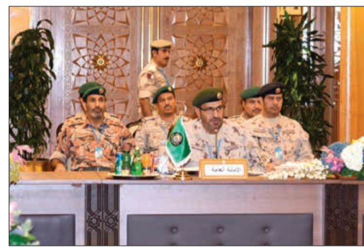
اللواء الركن أحمد آل علي لدى مشاركته بالاجتماع

لرؤساء الأركان، متمنيا لهم طيب الإقامة وللإجتماع كل التوفيق والسداد بما يرقى لطموح شعوبنا الخليجية وبقدر تطلعات وثقة قادتنا بحفظهم الله ورعاهم. من جانبه، أعرب الأمين العام المساعد للشؤون العسكرية في الإمانة العامة لمجلس التعاون الخليجي اللواء الركن أحمد آل علي في مستهل الاجتماع عن التقدير