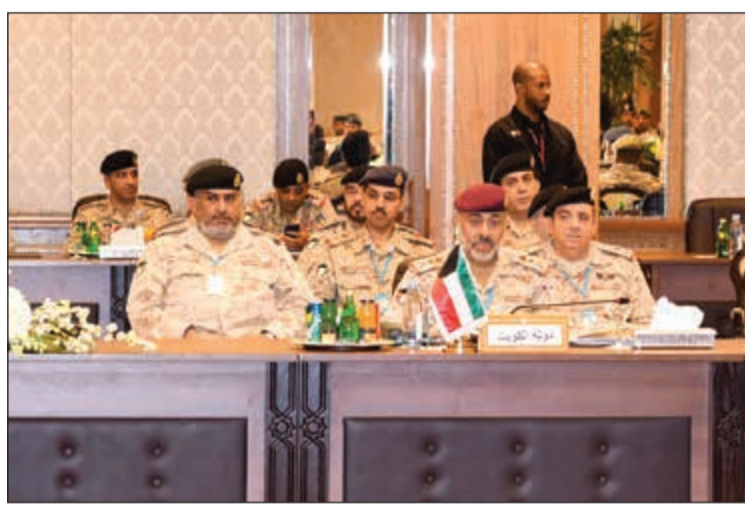
الفريق الركن الشيخ عبدالله النواف ووفد الكويت بالاجتماع

وقال اللواء ركن آل علي ان ملف اللجنة يتضمن عرضا لعدد من الموضوعات التي رفعتها لجنة العمليات والتدريب واللجنة المالية واطلعت عليها اللجنة التحضيرية وفي مقدمتها ما يتعلق بالقيادة العسكرية الموحدة والدراسة الخاصة بإنشاء الأكاديمية الخليجية للدراسات الاستراتيجية والأمنية، بالإضافة التي مشروعات خاصة بالاتصالات المؤمّنة. وأكد في هذا الصدد ان هذه الموضوعات ترتبط ارتباطا وثيقا بإدامة العمل العسكري المشترك واستمراره، معربا عن تطلعه الى المزيد من الرقعة والطموح الى ما ستتوصل اليه اللجنة من توصيات وقرارات