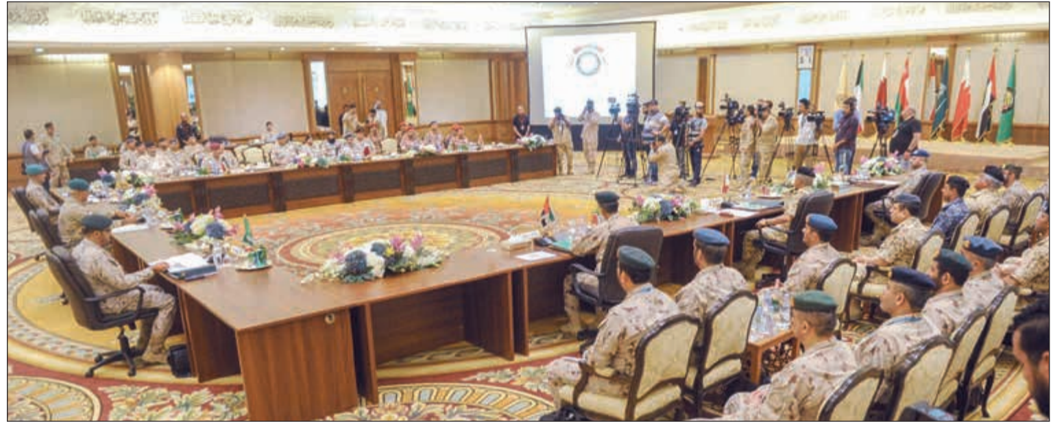
جانب من الاجتماع الـ 15 للجنة العسكرية العليا لرؤساء أركان دول التعاون