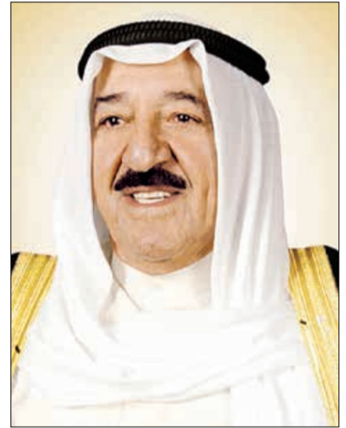
صاحب السمو الأمير الشيخ صباح الأحمد

ذكرت مصادر مطلعة في تصريحات خاصة لـ «الأنباء» أن الحكومة عند مناقشة قانون التقاعد المبكر تراجعت عن استقطاع نسبة 2٪ لكن تجدد الحديث عن استمرار قناعتها بتحمل نسبة 1٪ على أن تتم إضافة نسبة 1٪ على استقطاع المؤمن عليهم. وشددت المصادر على أن قناعة الحكومة تأتي انطلاقاً من مسؤولياتها في ضمان القدرة على استمرارية المؤسسة العامة للتأمينات في ضمان الحياة الكريمة للمتقاعدين والذي أكد عليه الدستور. وأضافت المصادر: بالرغم من إحقاق الحكومة ممثلة في فريق وزارة المالية والمؤسسة العامة للتأمينات أثناء المداولة الثانية التي تمت في شهر مايو الماضي في إقناع النواب بإضافة الـ 1٪، إلا أن هناك رأياً يؤيد المحاولة مجدداً حفاظاً على ديمومة الصناديق الاكتوارية للتأمينات. هذا، وناشدت مصادر نيابية مؤسسة التأمينات الاجتماعية ووزارة المالية عدم التمسك بإضافة نسبة 1٪ على استقطاع المؤمن عليهم البالغ عددهم 350 ألف موظف. وعبرت المصادر عن الأمل في عدم المطالبة في مداوات الاتفاق على تعديلات قانون التقاعد المبكر، ولن يؤثر التقاعد المبكر لهذا العدد المحدود في ديمومة الصناديق الاكتوارية لأن التعديلات تنص على استقطاع 5٪ عن كل سنة في حال الرغبة في التقاعد المبكر بحد أقصى 5 سنوات. وأشارت المصادر إلى أن إحقاق الحكومة هذه المرة لن يمكنها من إحالة القانون - في حالة تمريره من قبل 43 نائباً حسب المادة 66 من الدستور - إلى المحكمة الدستورية لأن تمسك النواب بعدم إضافة أعباء مالية على جميع الموظفين سواء الراغبون في التقاعد أو عدم الراغبين لا يحل شبهة دستورية. وجددت المصادر النيابية التأكيد على وجود توافق حول سحب المادة الرابعة التي تغل يد الحكومة في إحالة من خدم من النساء 25 عاماً والرجال 30 عاماً إلى التقاعد دون شرط السن.