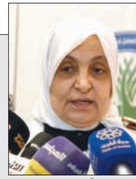
الوزيرة هند الصباح

الهاشل: الدينار مستقر أمام موجة تراجع العملات العالمية 17