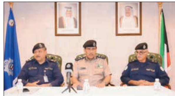
الفريق عصام النهام متوسلاً اللواءين جمال الصباح وإبراهيم الطراح خلال لقائه بأصحاب الحسينيات

دعا وكيل وزارة الداخلية الفريق عصام النهام مرتادي وأصحاب الحسينيات إلى ضرورة اتباع التعليمات والالتزام بالقوانين والإرشادات الأمنية والسلوكية داخل نطاق الحسينيات، مشدداً على ضرورة التعاون مع رجال الأمن. من جانبهم، عبر مقلو الحسينيات عن تقديرهم لجهود رجال الأمن في تقديم كل أشكال الدعم والمساعدة الإنسانية لجميع المواطنين والمقيمين. من جانب آخر، وجه وكيل وزارة الداخلية الفريق عصام النهام بضرورة تكثيف التواجد الأمني على الطرق السريعة المؤدية إلى المناطق السكنية الموجودة بها وبمحيطها العديد من المدارس لمنع عرقلة حركة السير والقضاء على الوقوف العشوائي أمام المدارس وعدم الالتزام بالخطوط الأرضية أو اللوحات الإرشادية. • التفاصيل 11