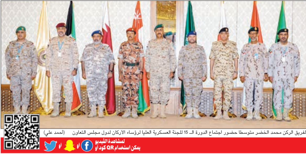
الفريق الركن محمد الخضر متوسلاً حضور اجتماع الدورة الـ 15 للجنة العسكرية العليا لرؤساء الأركان لدول مجلس التعاون (أحمد علي)

لمشاهدة الفيديو يمكن استخدام QR كود أو يمكن استخدام QR كود أو