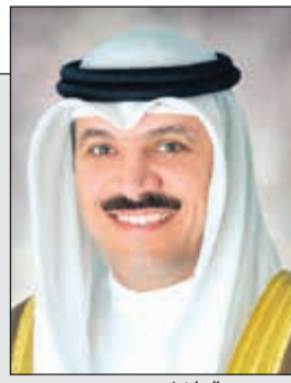
د. محمد الهاشل

الهاشل: الدينار مستقر أمام موجة تراجع العملات العالمية 17