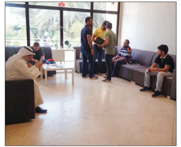
تهيئة بالعام الجامعي الجديد