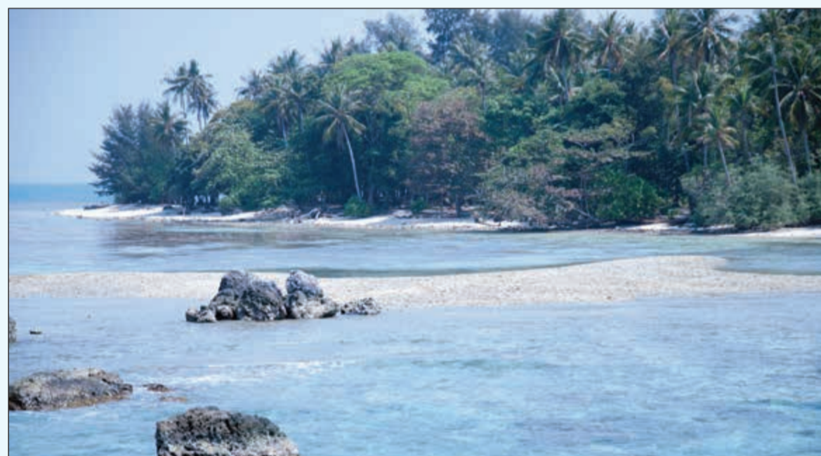
جزيرة Pantara واحة الاستجمام والخصوصية

أما الأطفال فلهم نصيب أيضا لا يقل عن الكبار من حيث الأنشطة والبرامج البحرية، فضلا عن المنطقة المخصصة لملاعب الأطفال وركوب الدراجات التي تتيح للعائلة قضاء أوقات من التسلية المرح والتقاط الصور التذكارية.