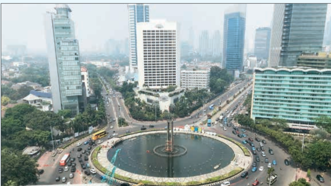
قلب العاصمة جاكارتا

وكما أشرنا في السابق، تعد إندونيسيا أكبر الدول الإسلامية من حيث تعداد