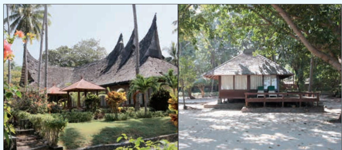
أكواخ سياحية بإطلالة بحرية ساحرة