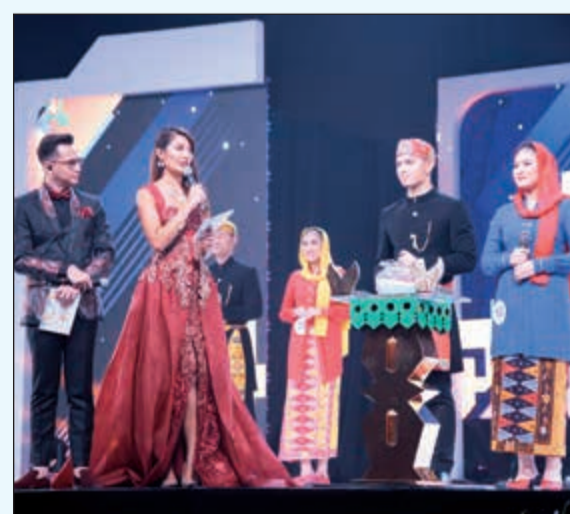
جانب من مسابقة «سفراء جاكارتا»