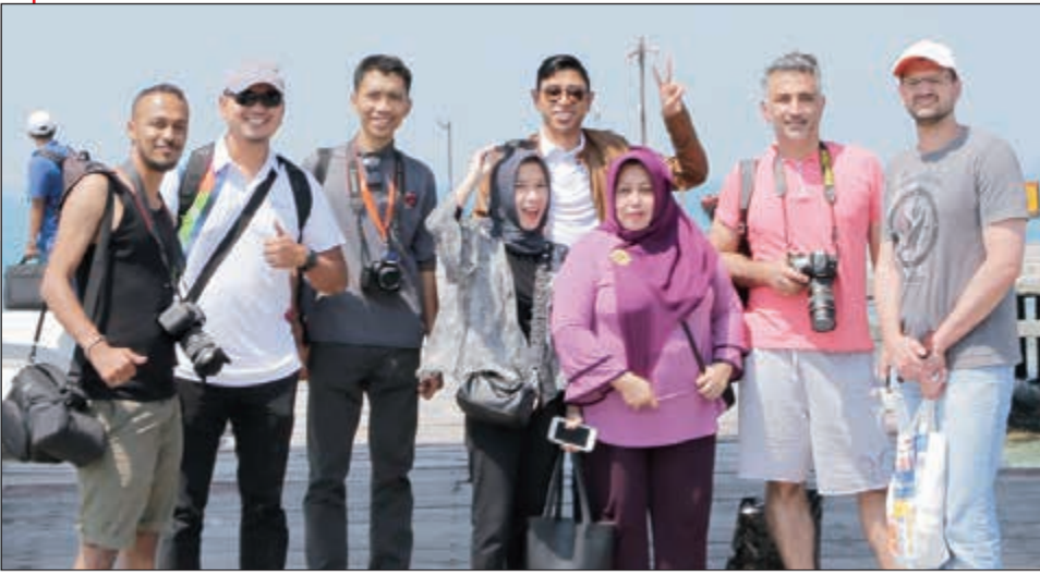
الوفد الإعلامي خلال الرحلة