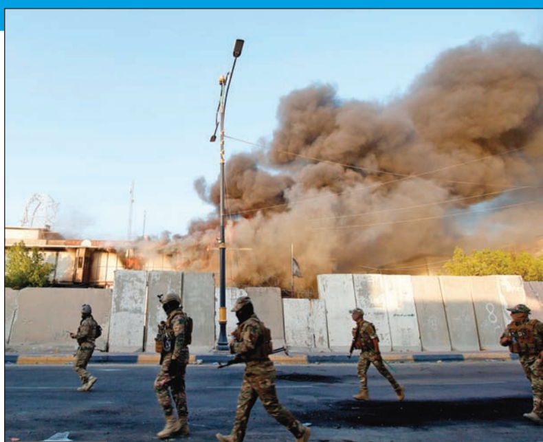
الدخان يتصاعد من مجلس محافظة البصرة الذي احترق أمس