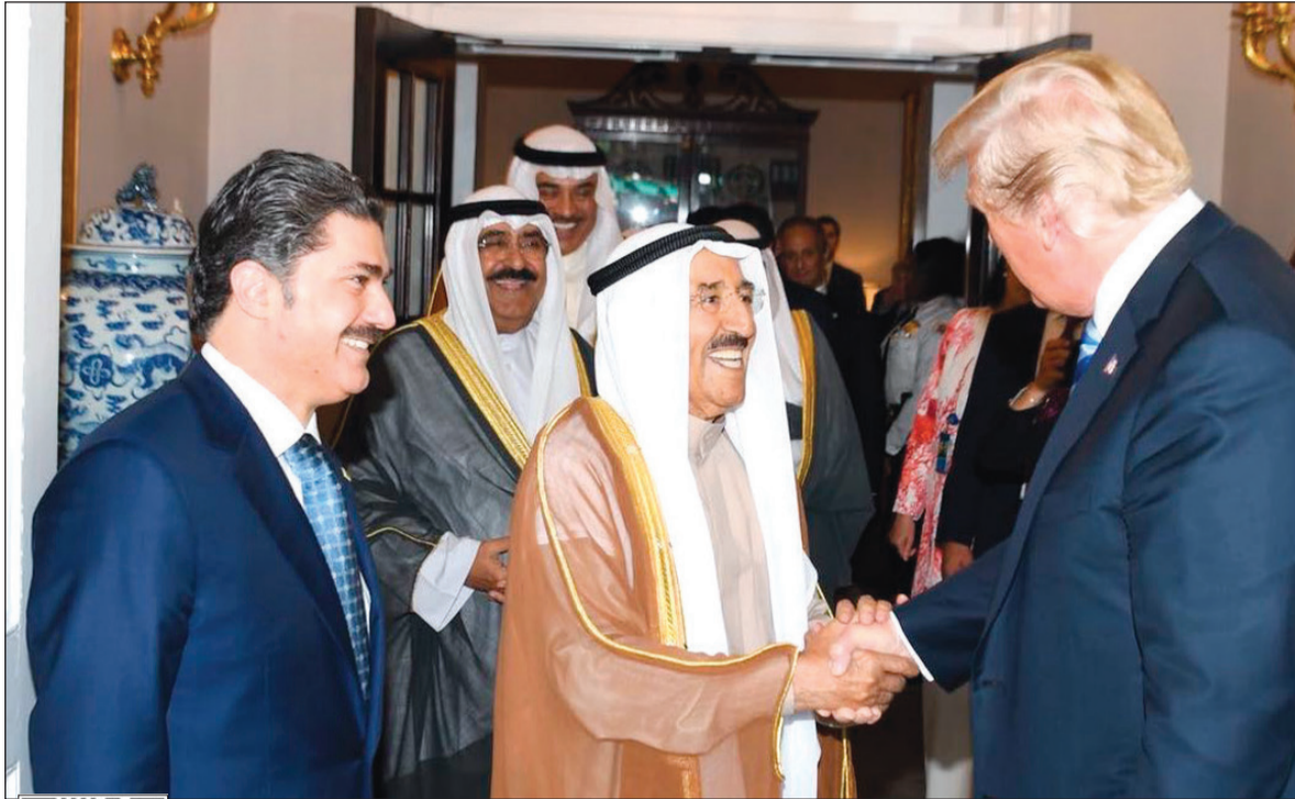
الرئيس دونالد ترامب يودع صاحب السمو الأمير الشيخ صباح الأحمد أمام البيت الأبيض بحضور الشيخ مشعل الأحمد والشيخ صباح خالد والشيخ خالد العبدالله وأعضاء الوفد

■ الغانم ونواب: زيارة سمو الأمير لواشنطن وضعت لبنة جديدة في العلاقات الإستراتيجية ونُسهم في تحقيق أمن واستقرار المنطقة