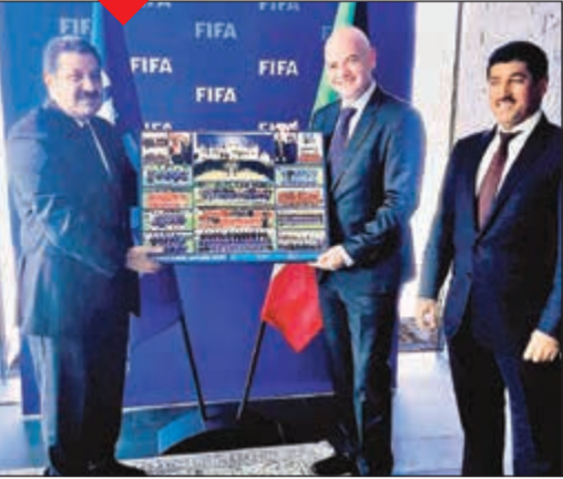
الشيخ أحمد اليوسف ود.محمد خليل خلال لقائهما مع جياني إنفانتينو