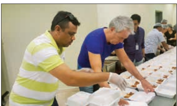
إعداد الوجبات في مطبخ سيمفوني ستايل