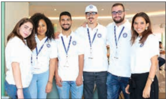
مشاركون في حفل «بي بي جي» السنوي

دبي: احتفلت مجموعة «بي بي جي»، التي تعد من أبرز وأقدم الشركات في قطاع الاتصالات التسويقية المتكاملة في المنطقة، بالفهم المتجدد لهيكل أعمالها الذي تمت إعادة تصوره مؤخرا، من خلال تنظيم الاجتماع السنوي الـ 25 لموظفيها على متن الفندق العائم لباخرة الملكة اليزابيث الثانية QE2 الأيقونية. وقد كشفت الشركة مؤخرا عن هويتها الجديدة ونهجها المتكامل والقوي الذي يتمحور حول عملاتها من خلال 3 وحدات أعمال أساسية تتمثل في بي بي جي أورتج وبي بي جي ماكس وبي بي جي الكويت. واحتفالاً بالفهم المتجدد للشركة، شارك موظفو