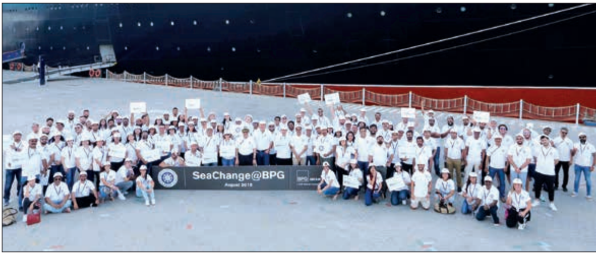
فريق «بي بي جي» في لقطة تذكارية