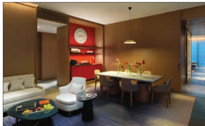
أحد غرف فندق فورسيزونز الكويت