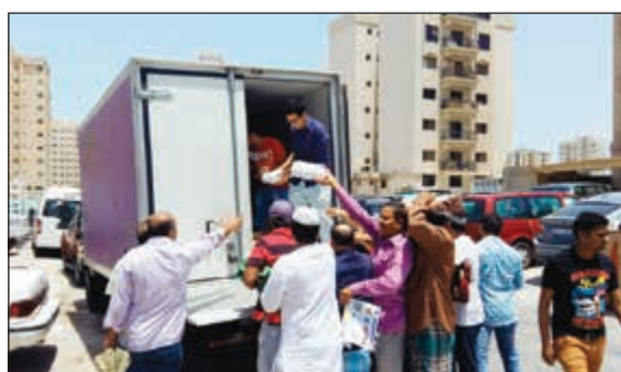
متطوعو «التجارية العقارية» يوزعون الوجبات على المتعافين

والمساهمة في إسعاد الآخرين، حيث يتطوع للمشاركة في الحملة الأسبوعية كل من موظفي الفندق وموظفي الشركة التجارية وعائلاتهم، إضافة إلى موظفي شركاتها التابعة والزميلة وفريق أمير الإنسانية التطوعي.