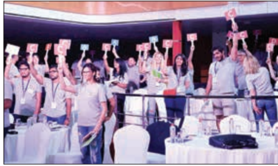
من يعرف الإجابة؟

النجاح المشترك لمجموعة بي بي جي وعملاتها. «أضف» قدمت لنا باخرة الملكة اليزابيث الثانية QE2 الإعدادات المثالية لتعزيز الشغف ومبادئ العمل المتقن والروح الجماعية عبر كل الفرق على مدى يومين - نهج نتبعه لضمان أن يكون عمالنا في طليعة المنافسة. تم تأسيس مجموعة بي بي جي منذ 4 عقود، وقد حققت نجاحا كبيرا منذ انطلاقتها في دبي. بدأت العمل عام 1980 وتعمل باستمرار على تحديث نهجها وابتكاراتها لتقديم حلول إبداعية متطورة بأسلوب يعتمد تخصصات متعددة، موجه نحو العصر الرقمي في الشرق الأوسط وشمال أفريقيا وأبعد من ذلك.