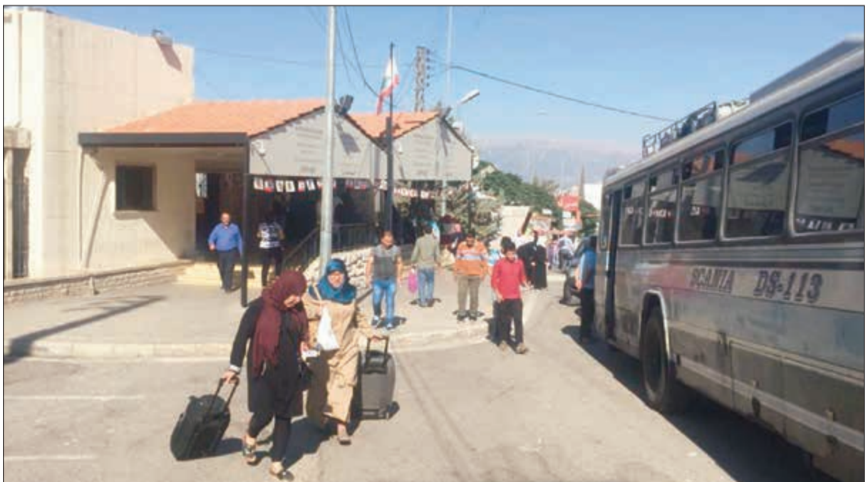
دفعة من النازحين السوريين خلال مغادرتهم لبنان إلى سورية عبر نقطة المصنع الحدودية (محمود الطويل)

ورغم اصرار الرئيس الحريري على انه لا احد اطلع على صيغة سواه والرئيس عون، فقد سربت معلومات تفيد بانها من 30 وزيراً وزعتهم الصيغة على الكتل النيابية من دون اسماء على الشكل التالي: عشرة وزراء لفريق الرئيس عون والتيار الحر وأربعة وزراء