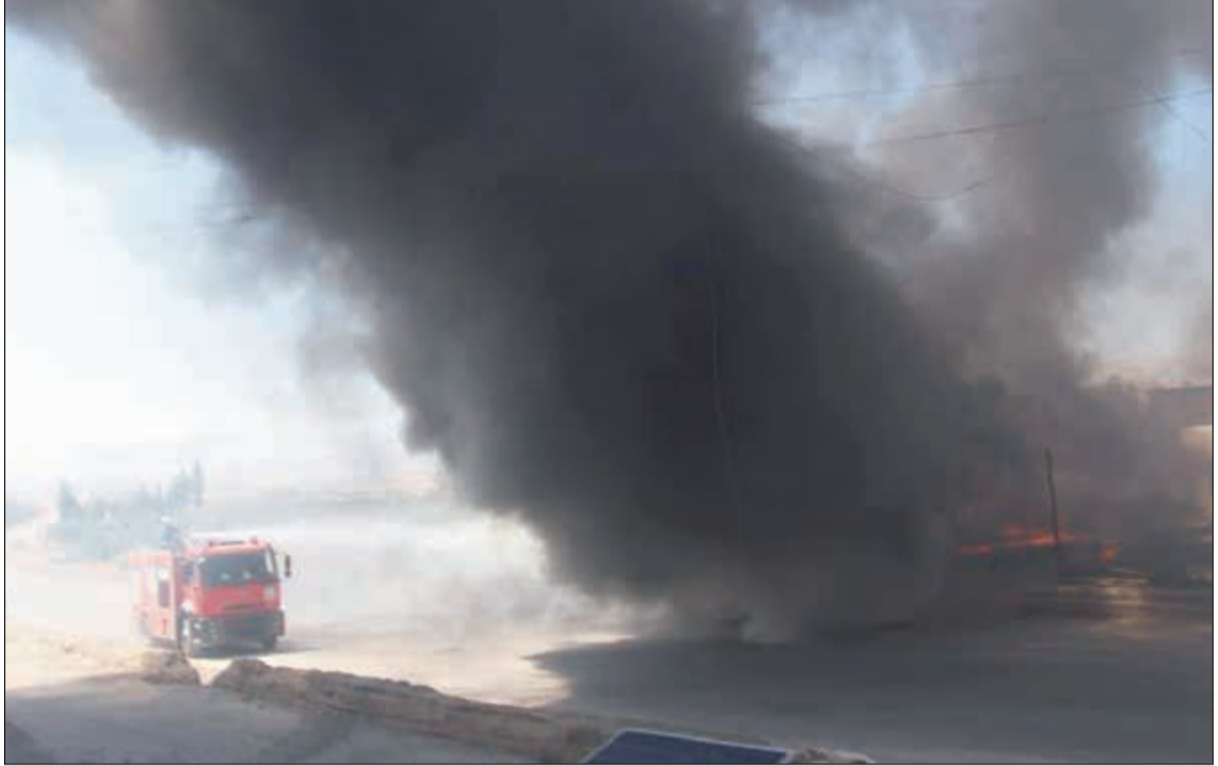
الدفاع المدني يحاول إطفاء الحرائق الذي سببته الغارات الروسية

وأوضحت المصادر أن القصف طال تجمعات سكنية بمدينة جسر الشغور وبلدات بسقول وإنب وسرمانية وغانى في إدلب، فضلا عن منطقة زبون بحماة. وذكر مرصد الطيران التابع للمعارضة على مواقع التواصل الاجتماعي أن «3 طائرات حربية روسية أقبلت من قاعدة حميميم بمحافظة اللاذقية، ونفذت 20 هجوما» على الأقل. بدوره، قال موقع «عنب بلدي» إن القصف أسفر عن مقتل