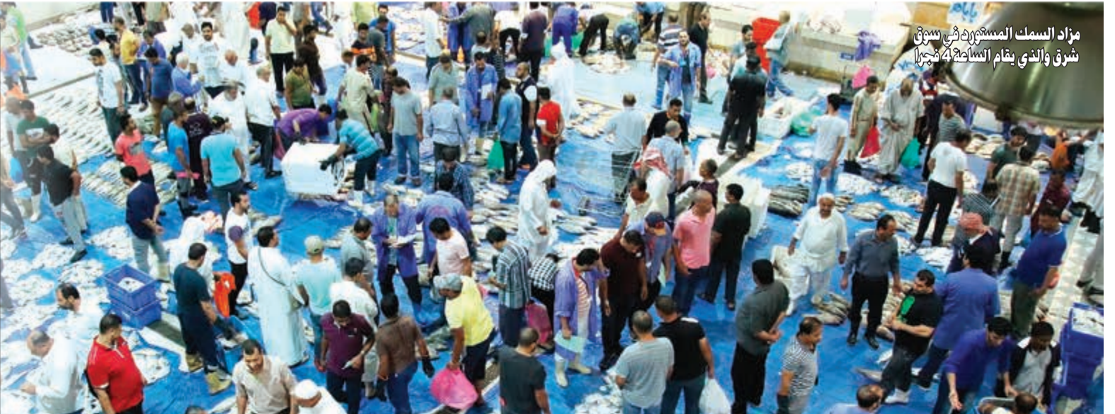
مزارع السمك المستورد في سوق شرق والتي بنظام الاسماك المجمدة

أكدوا أن ثمة حرباً شرسة ضد المستورد لا مبرر لها، وأشاروا إلى أنهم ساهموا في تخفيض الأسعار وتمهيد الطريق للمستهلكين من كل الأنواع