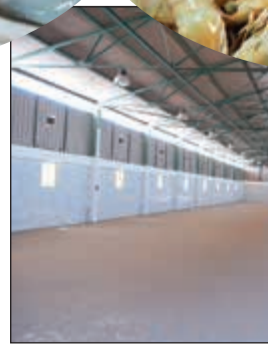
السوق الجديد غير مجهز بالشكل المطلوب للحفاظ على سلامة الأسماك

حتى تكتمل التجهيزات ويكون هناك سوق محترم، فنحن نشترى ونضع الأموال ولذلك نريد سوقاً جيداً.