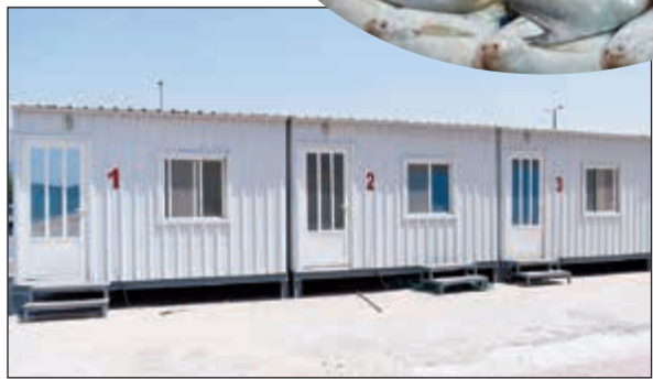
جانب من شبيرات سوق السمك الجديد في منطقة الري