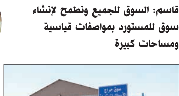
سوق السمك الجديد في منطقة الري (ريليش كوماز)

ورداً على سؤال عن وجود قرار وزاري بالانتقال إلى منطقة الري أجاب باننا لا نمانع في الانتقال، لكننا نريد تهئية السوق بشكل جيد وإيجاد شبيرات جيدة لحماية المنتج، فسوق شرق مجهز وفيه تكيف، كما نقوم بفرش السوق بالثلج ليصبح بارداً، مشدداً على رفض الانتقال إلى