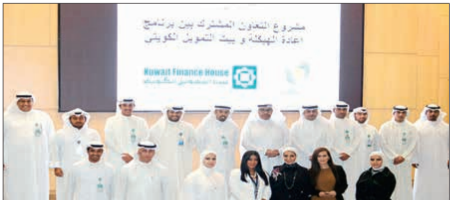
لقطة جماعية بين فرريقي البرنامج وبيت التمويل

أكد أمين عام برنامج إعادة هيكلة القوى العاملة والجهاز التنفيذي للدولة فوزي المجدي أن البرنامج لا يالو جهدا في دعم المسيرة التنموية الوطنية من خلال توظيف الشباب الكويتي من الجنسين في كافة مؤسسات القطاع الخاص.