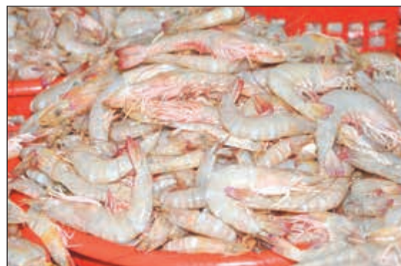
استمرار منع صيد الروبيان في المياه الإقليمية

من الروبيان تم صيده خلال فترة المنع، حيث لا نسمح بالاستيراد من ميناء الدوحة وإنما عن طريق المطار وتحديداً المستزرع، بالإضافة إلى أن فترة حظرهم في بحر الخليج أكثر من فترة حظرنا، لكن يسمح الصيد في خليج عمان وإيران تطل على هذا البحر وذلك قد تكون الأسماك من تلك المنطقة أما مناطقنا فلا، مشيراً إلى أنه قد تكون هناك تجاوزات ولكنها معدودة حيث جرى ضبط 5 لنجات دخلت في مياها الإقليمية الغلثاء الماضية وتم اتخاذ إجراءات بخصوصها، و7 لنجات في المياه الجنوبية للكويت تم التعامل معها وفق الأنظمة. وتابع الهبي بأن المنع لن يؤثر في أسعار الروبيان فهي مقاربة لأسعاره في العام الماضي، وهذا القرار ضروري لرجو الالتزام به للضرورة إلى النتيجة المرجوة منه في الأعوام المقبلة، وفي الوقت ذاته سسمحنا باستخدامها في 25٪ من المواقع في المياه الإقليمية فقط.