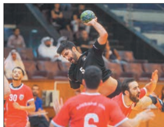
لقطة من مباراة الصليبخات والقرين خلال العام الماضي