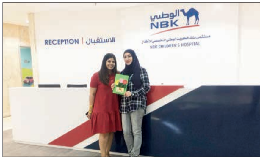
جانب من زيارة أسرة «كميفك» إلى مستشفى البنك الوطني التخصصي للأطفال