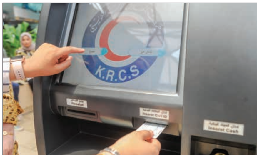
فتح التبرع عبر الإنترنت للمساهمة في تعليم المحتاجين