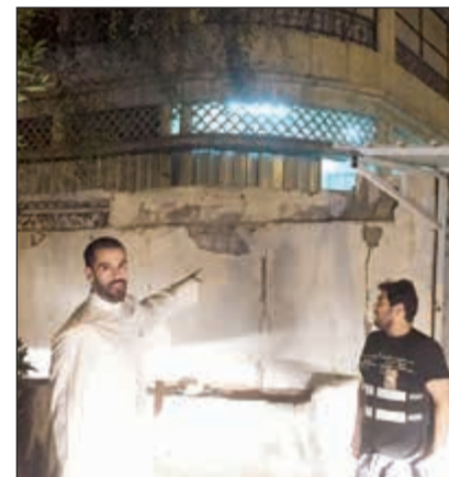
أحد المظاهر المخالفة

كشفت إدارة العلاقات العامة في البلدية عن قيام فريق الطوارئ بفرع بلدية محافظة العاصمة ممثلاً في النوبة (ب، ج) بتنفيذ جولات ميدانية مكثفة على منطقتي جابر الأحمد والمرقاب شملت توجيه إندارات وإزالة تعديات على أملاك الدولة.