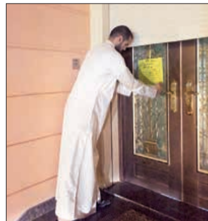
توجيه أحد الإندارات