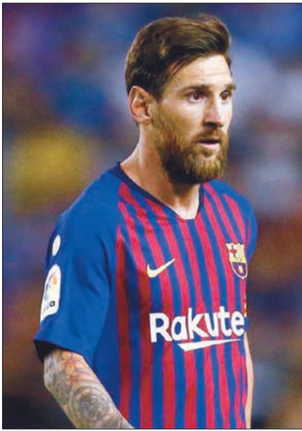
نجم برشلونة ميسي

تعرض منزل اللاعب الهولندي ممفيس ديباي للمسرقه خلال مشاركته في مباراة مع فريضة لليون ضد نيس ضمن الدوري الفرنسي، وأوضحت مصادر مقربة من التحقيق أن قيمة ما سرق من منزل اللاعب البالغ من العمر 23 عاما وصل إلى 1,5 مليون يورو، إلا أن الشرطة لم تؤكد هذا المبلغ، مشيرة إلى أنه لإزالة من المنكر تحديد القيمة الدقيقة للمسروقات. وغالبا ما ينشر ديباي عبر أنستغرام صورا تظهر أسلوب حياته الباذخ، كالسفر على متن طائرة خاصة أو تنضية إجازات على متن يخت، وبحسب تقرير أعدته صحيفة «ليكيب» الرياضية الفرنسية في فبراير 2018، يتقاضى ديباي راتبا شهريا إجماليا يصل إلى 350 ألف يورو. وحصلت عملية اقتحام المنزل والسرقه خلال مشاركة ديباي في مباراة فريضة ضد ضيفه نيس ضمن المرحلة الرابعة من الدوري الفرنسي، التي خسرها المضيف بنتيجة 1-0.