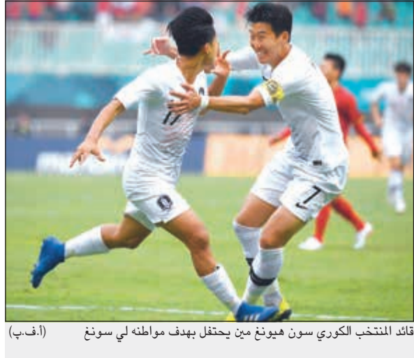
قائد المنتخب الكوري سون هيونج مين يحتفل بهدف موطنه لي سونج

فازت كوريا الجنوبية 1-3 على فيتنام في قبل نهائي مسابقة كرة القدم بدورة الألعاب الآسيوية في إندونيسيا وإذا احتفظت باللقب فهذا سيعني الكثير في مسيرة المهاجم سون هيونج - مين الاحترافية. وصنع سون (26 عاماً)، لاعب توتنهام الانجليزي، الهدف الثاني قبل استبداله في الدقيقة 72 وسيحصل على إعفاء من الخدمة العسكرية في بلاده إذا فازت كوريا الجنوبية باللقب. وينص القانون في كوريا الجنوبية على أن كل رجل سليم بدنيا يجب أن يتقدم لأداء الخدمة العسكرية لمدة 21 شهراً لكن يمكن للرياضيين الحصول على إعفاء إذا فازوا بميدالية ذهبية