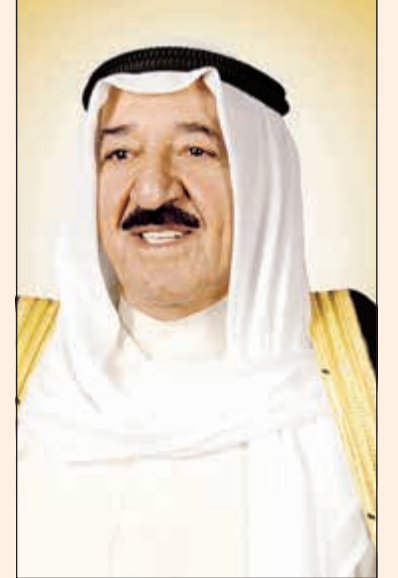
صاحب السمو الأمير الشيخ صباح الأحمد

بعث صاحب السمو الأمير أحمد برفقة تهنئة إلى اللاعب عيسى الزنجوي بحصوله على الميدالية البرونزية في منافسات رمي القرص خلال دورة الألعاب الآسيوية الثامنة عشرة المقامة في الجمهورية الإندونيسية. مشيداً سموه بهذا الإنجاز الرياضي الكويتي، متمنياً سموه للزنجوي كل التوفيق والنجاح لمواصلة عطائه الرياضي وتحقيق المزيد من الإنجازات الرياضية. وبعث سمو نائب الأمير وولي العهد الشيخ نواف الأحمد برفقة تهنئة إلى اللاعب عيسى الزنجوي بحصوله على الميدالية البرونزية في منافسات رمي القرص خلال دورة الألعاب الآسيوية الثامنة عشرة المقامة في الجمهورية الإندونيسية، متمنياً له هذا الإنجاز الرياضي الذي حققه، متمنياً له مواصلة عطائه الرياضي لتحقيق المزيد من الإنجازات الرياضية. كما بعث سمو رئيس مجلس الوزراء الشيخ جابر المبارك برفقة تهنئة مماثلة.