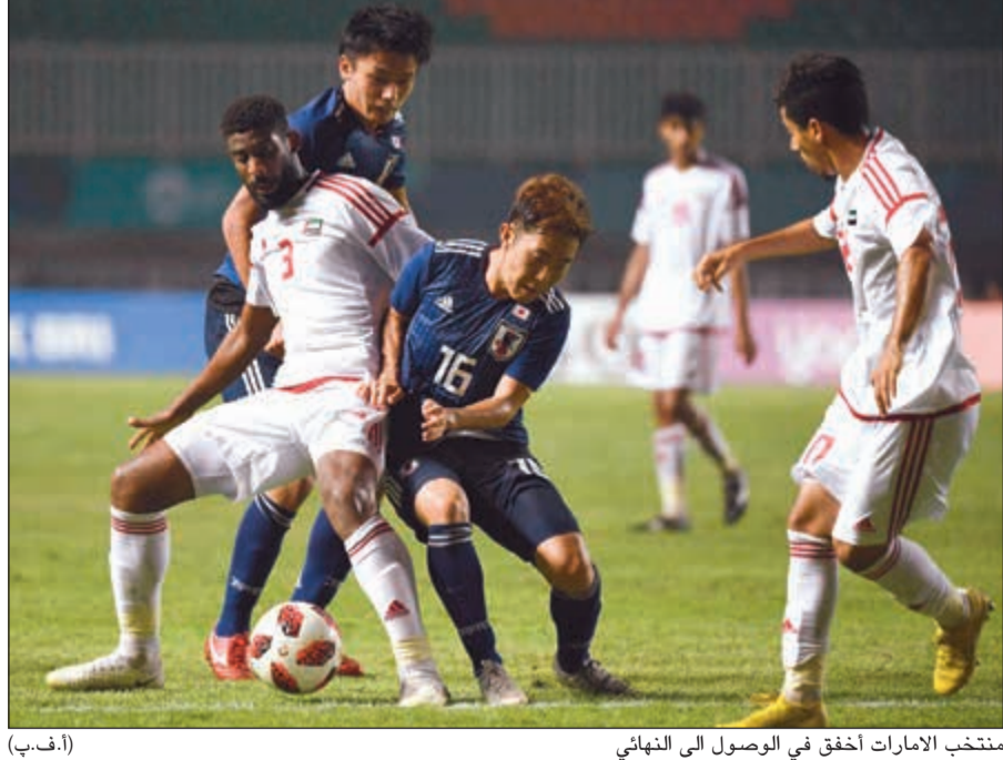
منتخب الإمارات أخفق في الوصول إلى النهائي