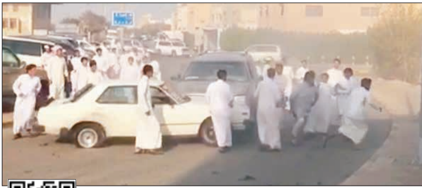
من المشاجرة التي لم تلتق «الداخلية» بشأنها بلاغا