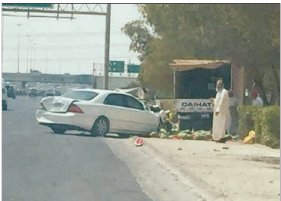
المركبة الألمانية بعد اصطدامها بسيارة الرقي

واستنادا إلى مصدر أممي فإن عمليات الداخلية تلقت بلاغا بوقوع حادث تصادم بين هاف لوري متوقفة على الرابع وأخرى ألمانية، فانتقل رجال الأمن إلى موقع البلاغ وتبين أن السيارة المتوقفة كانت محملة بالبرقي وكان يقف إلى جوارها بائع عربي، فيما قال قائد الألمانية أن سيارة مجهولة اصطدمت به فاختل مقود مركبته في يده وانحرفت باتجاه سيارة الرقي.