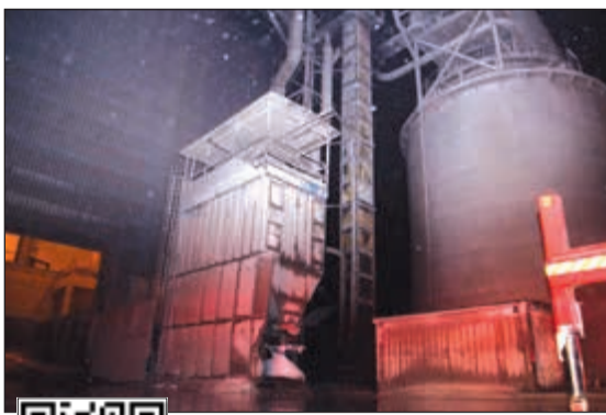
السيطرة تمت على الحريق بكفاءة