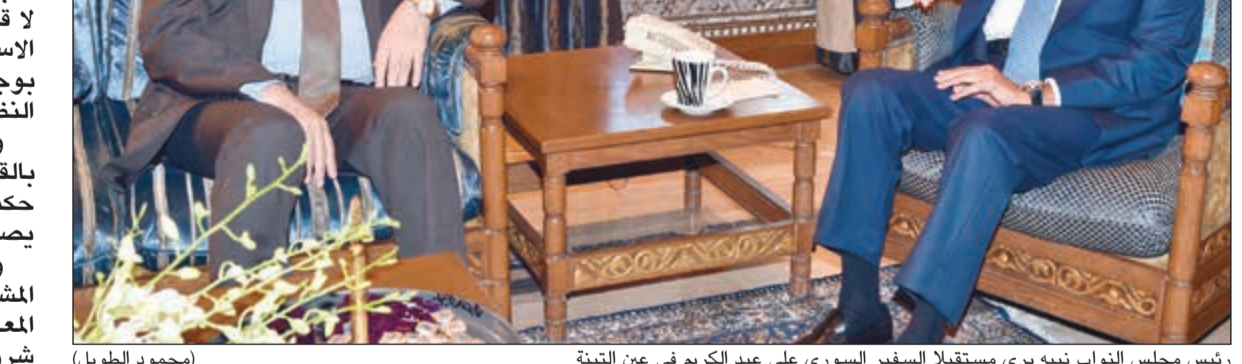
رئيس مجلس النواب نبيه بري مستقبلاً السفير السوري علي عبد الكريم في عين التينة

عون فجاءه الجواب: لقد التقى وزير الاعلام القواني ملحم رياشي، وبدا ان بري كان ينتظر لقاء مختلفاً. وقلل بري من أهمية موقع نائب رئيس الحكومة الذي لا صلاحية له ولا مكتب في السراي او وزارة الدفاع الشكلية الدور، والتي صلاحيتها بجزرة قائد الجيش، واستغرب التنافس على هذين الموقعين الرمزيين. من جانبه، نفى جنبلات وجود عقدة درزية، فلماذا الحديث عن عقدة درزية؟ اذا كنا نريد ان نقول عقدة درزية فلنرجح الانتخابات من جديد، لقد ربحنا الانتخابات، واذا ربحنا مجدداً تعود العقدة، واذا خسرتنا صحتين على قلبهم، اما عن «العقدة المسيحية» فقد رأى جنبلات ان القوات اللبنانية محقة، واعتبر ان الاستحقاقات