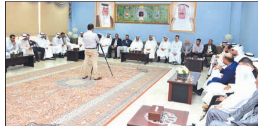
جانب من تجمع قيادات وموظفي الهيئة الخيرية لتبادل التهانى بالعيد

أعلن مدير عام الهيئة الخيرية الإسلامية العالمية م. بدر سعود الصميط أن الهيئة نفذت خلال أيام عيد الأضحى المبارك أكثر من 13 ألف أضحية في 28 دولة حول العالم استفاد منها 520 ألف نسمة من الأشد فقراً في بلدانهم. وأضاف الصميط في كلمة له خلال حفل تبادل تهاني عيد الأضحى المبارك بين موظفي الهيئة أن تكلفة مشروع أضحى الهيئة لهذا العام والتي نفذت تحت شعار (أضحك خير تلقاه - الألاف بانتظارها) بلغت 420,720 ألف دينار بما في ذلك مساهمات عوائد وقفية الأضحى. وبين الصميط أن الهيئة جمعت أيضاً أكثر من 360 ألف (د.ك.) لمشاريع أخرى متنوعة بين التعليم والصحة وكفالة الأيتام والدعوة، إضافة إلى (80 ألف د.ك.) حققتها حملة (شفاء في 10 د.ك.) خصصت لإنقاذ حياة أكثر من 18 ألف مريض في قطاع غزة بفلسطين من خلال توفير الأدوية والعلاجات المناسبة لهم منعا لتفاقم أوضاعهم الصحية و (22 ألف د.ك.) لكسوة وعيديات اليتيم. وتوجه بالشكر والتقدير والعرفان إلى المتبرعين الذين كان لهم الفضل بعد الله في إدخال الفرح والسرور على نفوس مئات آلاف الفقراء من خلال توفير لحوم الأضحى لهم، مبيناً أن نسبة كبيرة