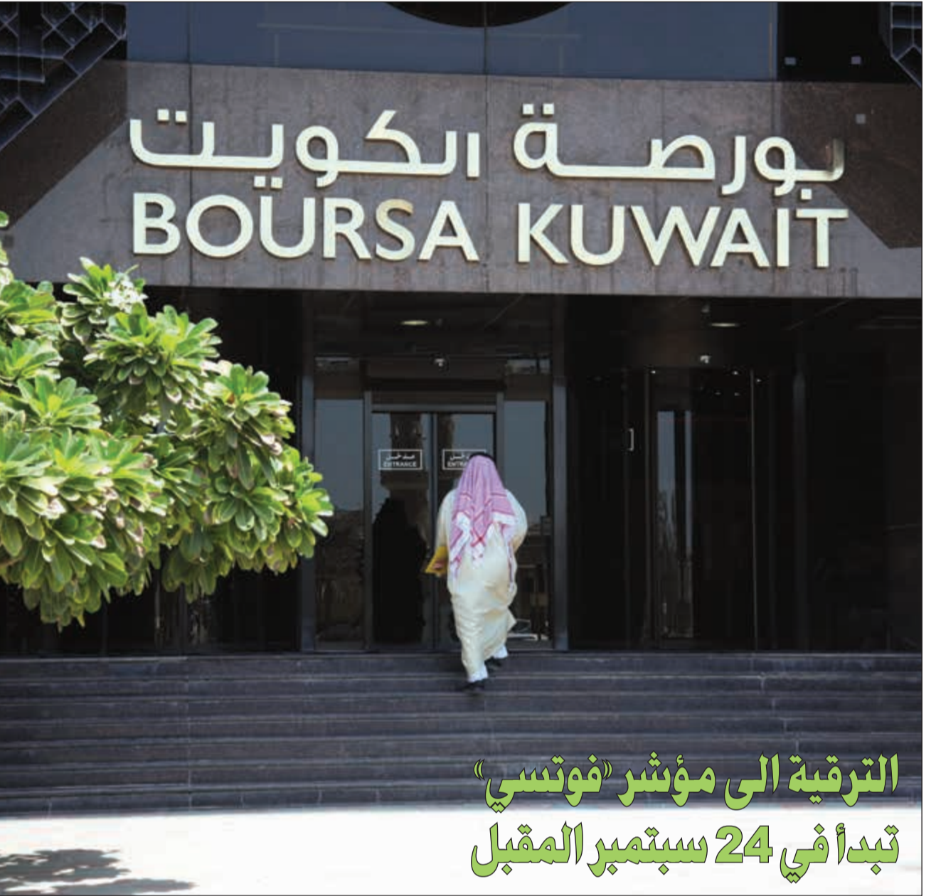
البورصة تستعد لتدفق استثمارات أجنبية كبيرة عقب إعلان القائمة النهائية لاثني عشر سهما كويتيا لإدراجها على مؤشر فوتسي للأسواق الناشئة (زين علام)

استثمارات أجنبية وفي موازاة الترقب لدخول الأسهم في قائمة فوتسي شهدت بورصة الكويت أكبر تدفق شهري للاستثمارات الأجنبية في تاريخها خلال شهر يوليو الماضي، حيث حقق الاستثمار الأجنبي صافي شراء بقيمة 48,4 مليون دينار خلال تعاملات الشهر. ومنذ بداية العام وخلال سبعة أشهر، قام الأجانب بضخ 350 مليون دولار (ما يزيد على 104 ملايين دينار) في الأسهم الكويتية كصافي شراء لتعاملاتهم خلال تلك الفترة وتخطى تلك القيمة إجمالي صافي الاستثمارات الأجنبية التي تدفقت للبورصة خلال السنوات الثلاث الماضية وتقترب بالعام الحالي من أكبر استثمارات سنوية تدفقت للبورصة الكويتية في تاريخها