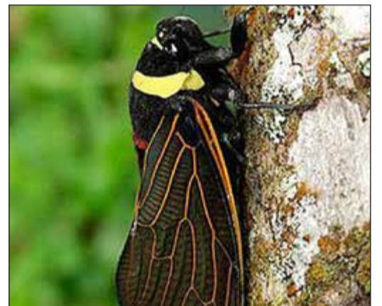
الزيزان تنغص على السياح عطلتهم

أ.ف.ب: صوتها مرادف للبحر المتوسط في فصل الصيف، إلا أن بعض السياح الفرنسيين يعتبرون أن الزيزان في منطقة بروفانس صاخبة جدا. وقد اشتكى العديد منهم إلى رئيس بلدية بلدة بوسيه في منطقة فار في جنوب شرق فرنسا من أن هذه الحشرات تنغص عليهم متعة الاسترسال في النوم خلال العطلة. وقد سال بعضهم أصحاب متاجر في البلدة حول كيفية الحصول على مواد كيميائية للتخلص من هذه الجلبة الصادرة عن الزيزان التي «تغني» بحثا عن رفيق أو رفيقة.