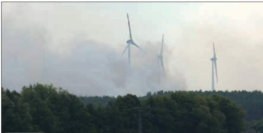
رائحة الحريق إلى العاصمة الألمانية