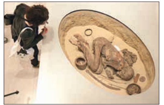
المومياء المصرية في متحف تورينو

أ.ف.ب: عثر باحثون في متحف تورينو في إيطاليا على مومياء مصرية تظهر أن التحنيط أقدم بكثير مما كان يعتقد. وبموجب هذا الاكتشاف، يبدو أن وضع كمية من الزيت النباتي أو الدهن الحيواني مع زيت الصنوبر الساخن وبعض النباتات العطرية والسكر النباتي للحفاظ على جثث الموتى، فن يعود إلى 3500 عام قبل الميلاد، وفقا لدراسة منشورة في مجلة «أكولوجيكال ساينس». وكان المصريون القدامى يؤمنون بالبعث والحياة الأبدية، ولذا كانوا يحنطون أجساد موتاهم قبل وضعها في القبور، مع ما يلزم الميت من أدوات تفيده في العالم الآخر وفق اعتقادهم.