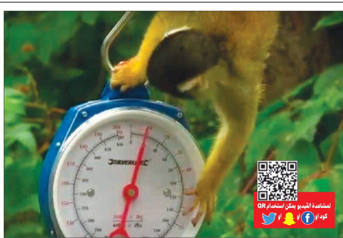
عملية الوزن أو قياس الطول ليست بالأمر اليسير وخاصة في حالة القردة