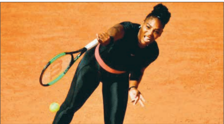
سيرينا وليامس أمام مشوار صعب في بطولة أميركا

فرضت قرعة بطولة أميركا المفتوحة للتنس مشوارا صعبا على النجمة الأميركية سيرينا وليامس الساعية لمعادلة الرقم القياسي في عدد الألقاب الكبرى والبالغ 24 لقباً عندما تشارك في البطولة بوجودها في مسار شقيقتها الكبرى فنيوس والمصنفة الأولى عالميا الرومانية سيمونا هاليب، وتبدأ سيرينا، الفائزة باللقب في نيويورك 6 مرات والمصنفة 17، مشوارها بمواجهة البولندية ماجدا لينيت المصنفة 60 عالميا وقد تواجه فيدوس في الدور الثالث قبل مواجهة محتملة في الدور الرابع أمام لاعبة الرومانية المصنفة الأولى.