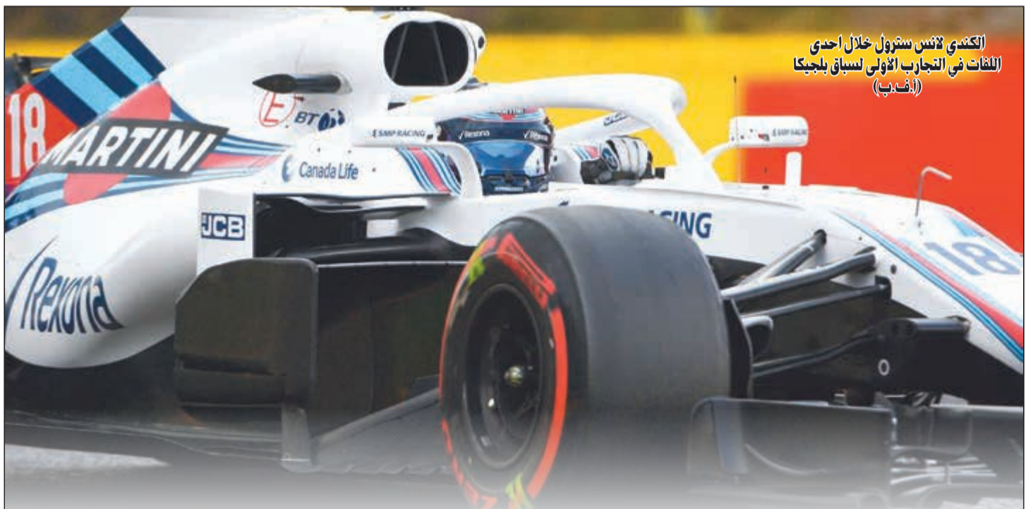
الكندي لانس ستروول خلال إحدى اللفات في التجارب الأولى لسباق بلجيكا (ألف.ب)

الكندي لانس ستروول خلال إحدى اللفات في التجارب الأولى لسباق بلجيكا (ألف.ب) سجل الألماني سيبستيان فيتيل سائق فريق فيراري أسرع زمن أمس في التجربة الحرة الأولى لسباق الجائزة الكبرى البلجيكي المقرر غدا الأحد مع استئناف منافسات بطولة العالم لسباقات سيارات فورمولا 1، بعد انتهاء الإجازة الصيفية. وحقق فيتيل المركز الأول متفوقا على ماكس فيرستابن سائق ريد بول على مضمار سبا-فانكورشان، وجاء بطل العالم البريطاني لويس هاميلتون سائق مرسيدس في المركز الثالث.