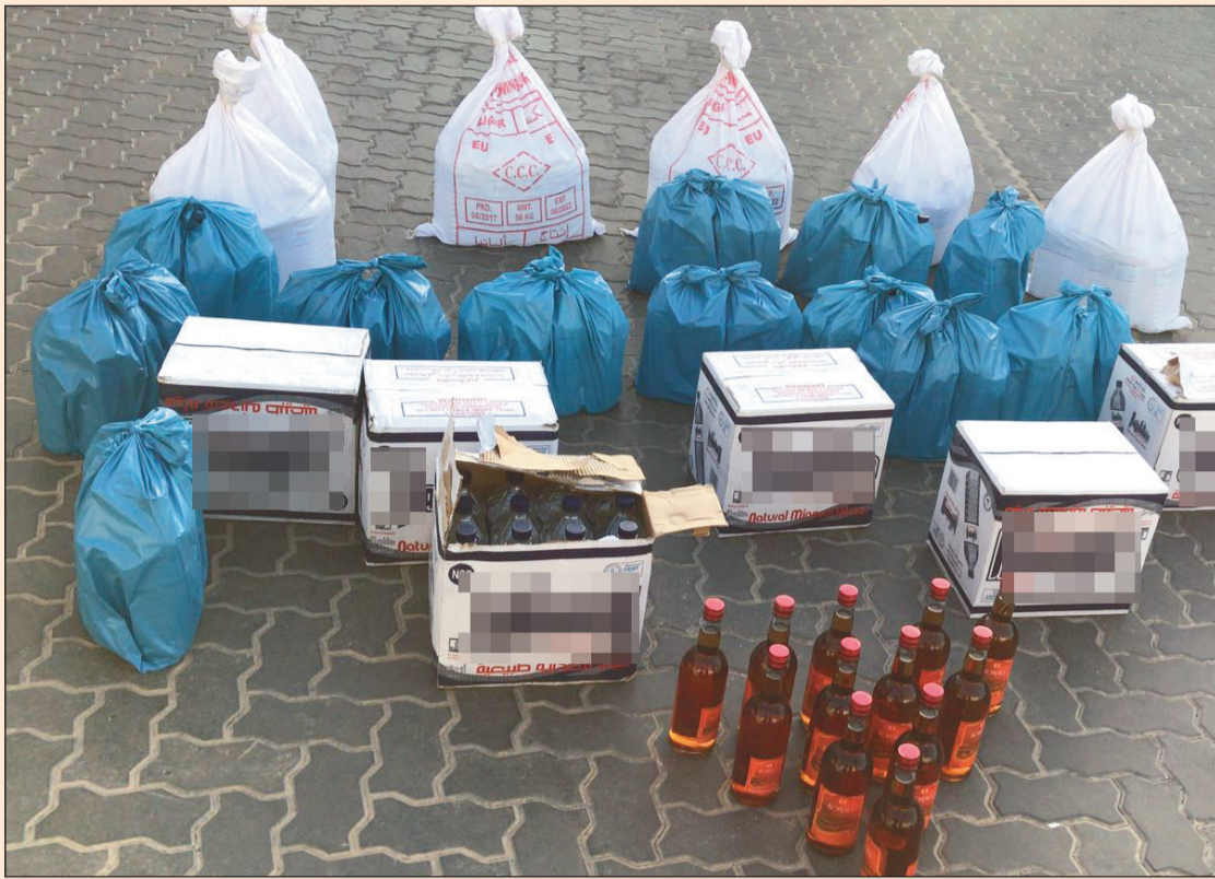
كمية الخمر التي عثر عليها في مركبة الآسيوي

من الخمر المحلية والمستوردة في المقعد الخلفي وكذلك في مؤخرة المركبة، وعند سؤال الوافد أفاد في التحقيقات الأولية بأنه يبيع القنينة بـ 5 دنانير لأبناء جالينته، وطالب الوافد رجال النجدة بتركه وعدم احتجازه إلا إن طلبه قوبل بالرفض، وأحيل إلى الحجز تهيئاً لإبعاده عن البلاد ومنعه من دخولها مرة أخرى.