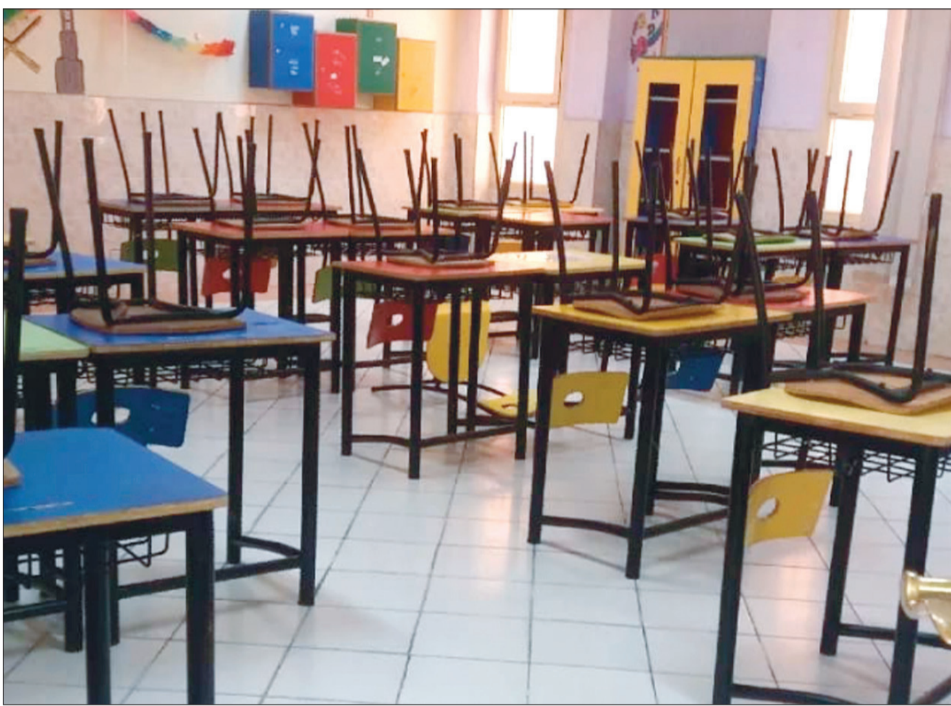
استعدادات مكثفة في المدارس لبدء العام الجديد

وعدم التحريض على الكراهية ونبذ مظاهر التطرف والعنف.