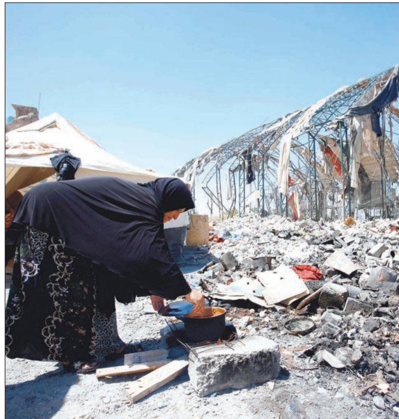
عراقية تطبخ في العراء بجانب خيمة تعيش فيها في الموصل المدمرة

العبادي يلغي قرار سحب «الحشد» من مراكز المدن السيستاني يحذّر من تفشي الأوبئة في البصرة