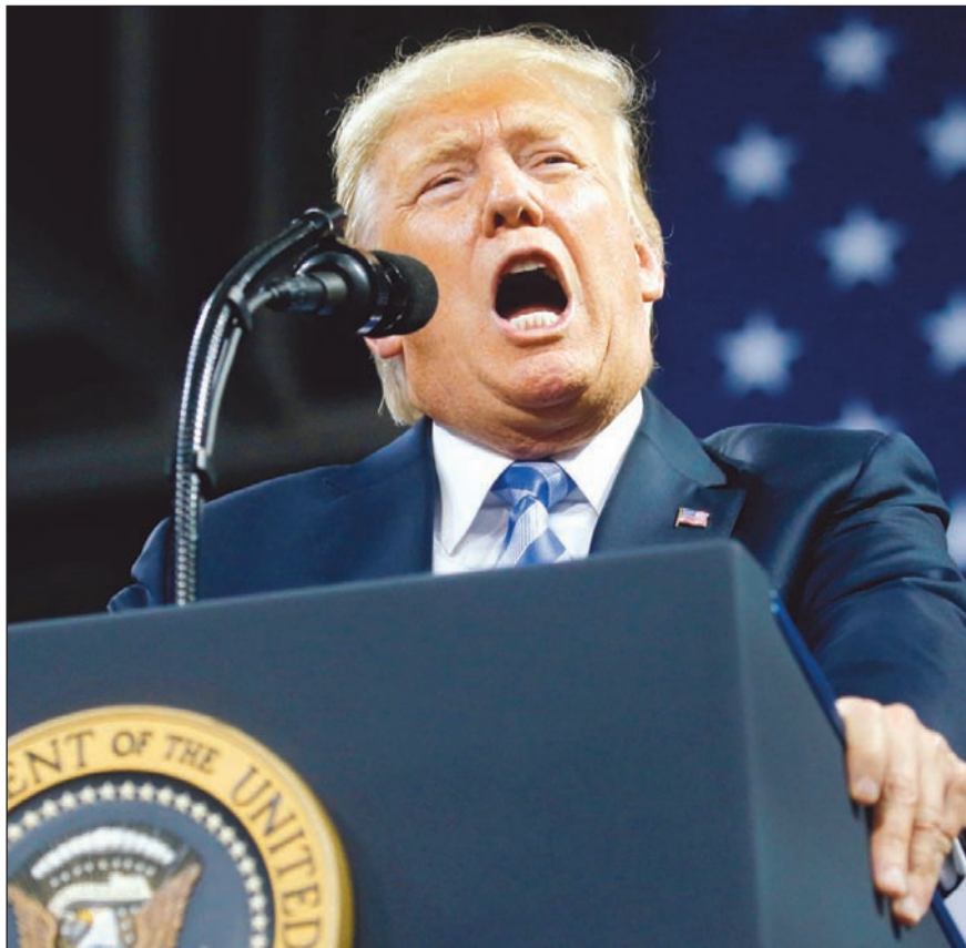
الرئيس دونالد ترامب يخاطب في مهرجان «لنجعل أميركا عظيمة من جديد» في فريجينيا الشرقية (رويترز)

الرئيس يتهم منصات التواصل الاجتماعي بـ «إخراص الملايين» محامي ترامب يحذّر من «ثورة» شعبية في حال عزله