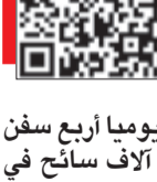
يمكن استخدام QR كود أو المشاهدة الفيديو

صمدت كوتور لؤلؤة البحر الأدرياتيكي المطلية على خليج خلاب في مونتينغرو أمام أهواء الطقس وأهوال الحروب منذ القرون الوسطى، إلا أنها مهددة اليوم بالسياحة الكثيفة.. فقد اجتاحت هذا الخليج سفن سياحية ضخمة حاملة آلاف السياح إلى هذا الحصن الذي بقي لفترة طويلة «كنزاً دفيناً»، وصفه الشاعر البريطاني لورد بايرون بأنه «انصهار مثالي بين البحر واليابسة»، فمع أسوارها ومرافئها وأبنيتها المنشيدة بالحجر الأبيض داخل أجراف