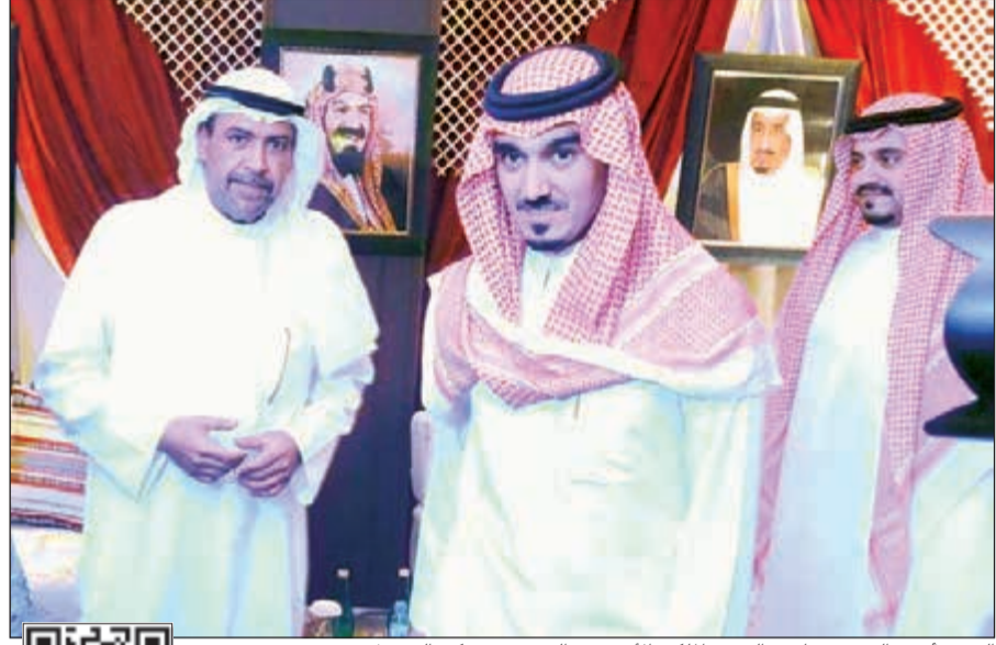
الشيخ أحمد الفهد وصاحب السمو الملكي الأمير عبدالعزيز بن تركي الفيصل