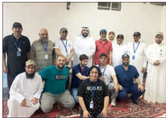
وزير الصحة في صورة جماعية مع فريق الخدمات الطبية لبعثة الحج