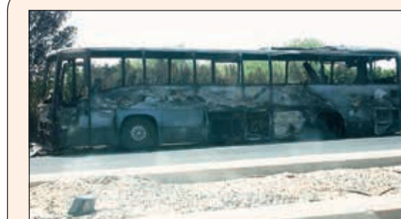
الباص الذي التهمته النيران

الباص المشتعل لا يحمل أي ركاب سوى قائده الآسيوي الذي نجا من الحريق حيث أسرع بالتوقف والنزول من الباص بمجرد اكتشافه للحريق. وسيطر رجال الإطفاء على النيران المتصاعدة من الباص والتي التهمت أجزاء كبيرة منه، وتم إخمادها تماماً.