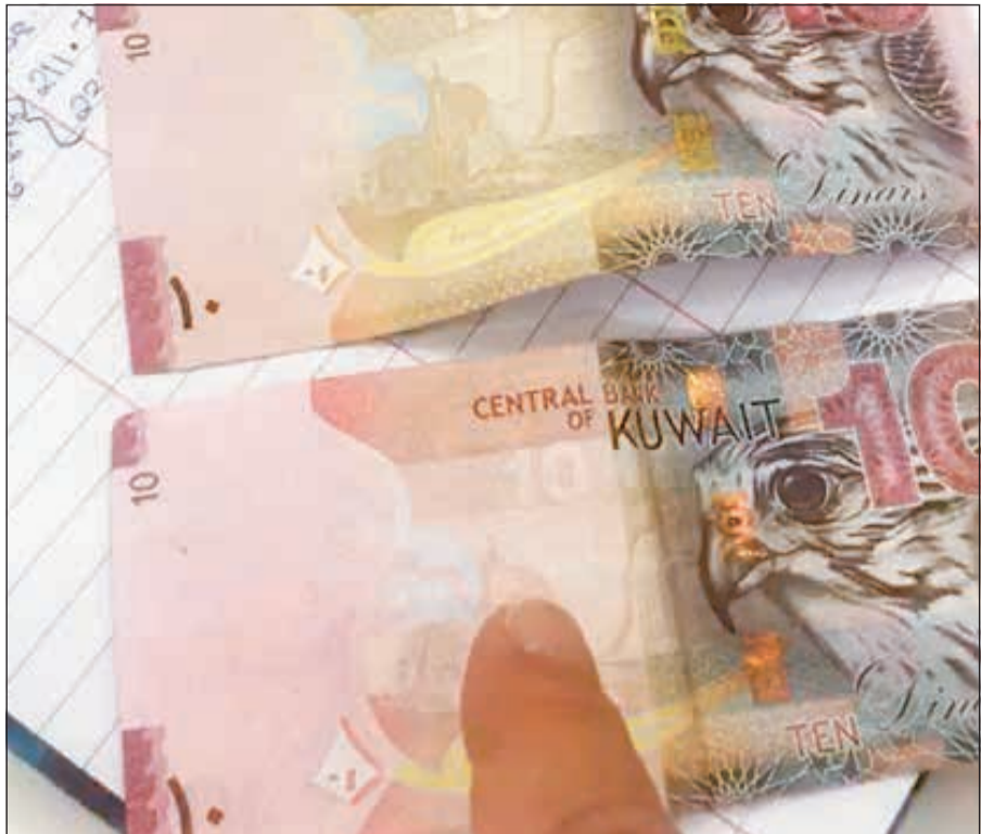
عملة مزورة واخرى حقيقية ومقارنة بينهما

وأرفق في ملف الإحالة المضبوطات التي تم العثور عليها في مسكنه. واللافت في القضية وحسب تأكيد المصدر أن المزور حينما تسلم الـ 20 ديناراً الحقيقية أخذ يتفحصها خشية أن تكون مزورة.