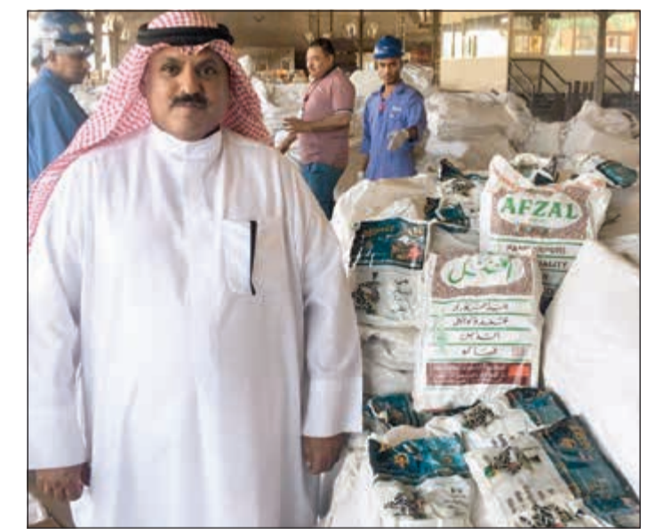
مراقب التفتيش أمام المضبوطات