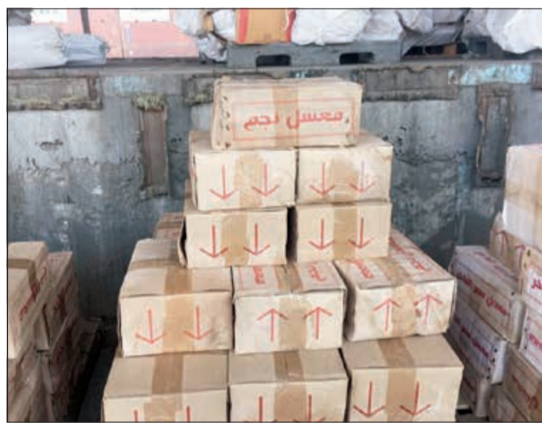
معسل منتهي الصلاحية