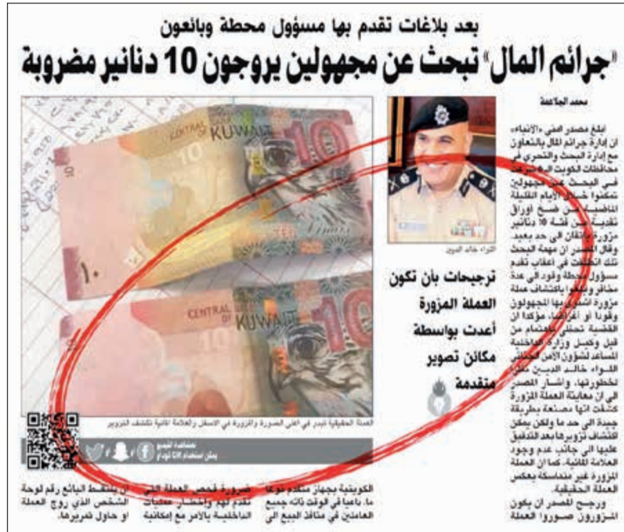
صورة زنكوغرافية للخبر الذي أفردت بـ «الأنباء» 12 أغسطس الجاري

أوراق من العملة المزورة. وقال المصدر: تم التواصل مع النيابة العامة وإبلاغ وكيل النائب العام بما انتهت إليه التحريات والصفقة التي أبرمت مع المواطن، وفي الموعد المحدد حضر بائع العملة المزورة وبعد أن سلم