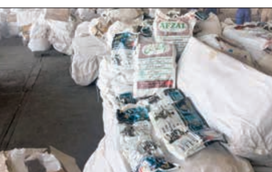
كميات التمباك التي ضبطت بإحدى الحاويات

تبين أن واحدة منها قادمة من بنغلاديش ولدى تفتيشها بدقة تبين وجود مخايم سرية تحوي كميات كبيرة من التمباك كما تم الاشتباه في حاويتين أخريين الأولى بها بخور والثانية بها اكسسوارات ولعب أطفال وتبين احتواؤها على التمباك أيضاً. أما الحاويات الـ 7 التي تحوي على معسل ورد من مصر فقد تبين أنه غير صالح للاستخدام وقام مراقب التفتيش والاستيداع بميناء الشويخ مساعد الحليبة بإخطار مدير عام الجمارك المستشار جمال الجلاوي بالضبطية والتحفظ على المضبوطات.