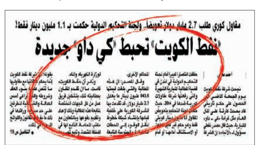
صورة زئبقية لخبر «الانباء» الذي تم نشره يوم الأحد الماضي