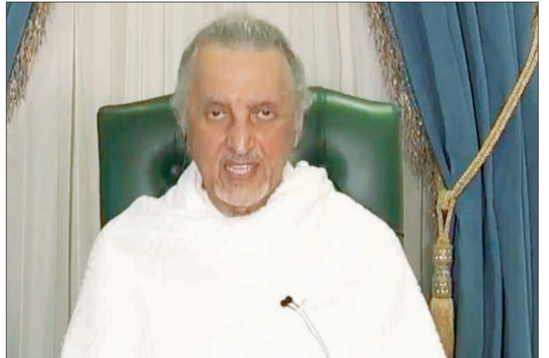
صورة تلفزيونية للأمير خالد الفيصل مستشار خادم الحرمين الشريفين أمير منطقة مكة المكرمة رئيس لجنة الحج المركزية

دراسات رفعت من هيئة تطوير منطقة مكة المكرمة إلى الهيئة الملكية لتطوير مكة والمشاعر المقدسة. كما أشاد الأمير خالد الفيصل بجهود صاحب السمو الملكي الأمير عبدالله بن بندر بن عبدالعزيز نائب أمير منطقة مكة المكرمة، وما يقوم به من جهود لخدمة المنطقة، مؤكداً أن وجود سموه في هذا المكان والمنصب مكسب كبير للمنطقة.