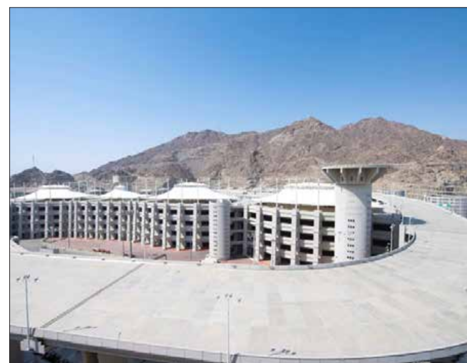
جسر الحجرات جاهز لاستقبال الحجاج اليوم

الرياض - واس: أكد قائد قوات أمن الحج الفريق أول ركن خالد بن قرار الحربي، جاهزية منشأة الحجرات لاستقبال الحجاج، عبر منظومة أمنية مكونة من الأمن العام (قوة المنشأة) ومن قوات الطوارئ الخاصة الموكلة لها إدارة وتنظيم حركة الحشود في منشأة الحجرات. وأوضح الحربي - في تصريحات أوردتها وكالة الأنباء السعودية (واس) - أنه تم وضع العديد من الخطط الأمنية بالتنسيق مع الجهات لتسهيل حركة تفويج الحجاج، التي تكفل الحفاظ على أمنهم وسلامتهم، مشيراً إلى أنه سيتم توزيع الحجاج القادمين للحجرات من مختلف الجهات والطرق على مختلف الأدوار بمنشأة الحجرات وفق خطط وآليات أعدت منذ وقت مبكر بما يضمن نجاح وتسهيل عملية دخولهم لمنشأة الحجرات. وقال الحربي إنه تم وضع العديد من الخطط الأمنية لتفويج الحجاج إلى مشعر مزدلفة ثم منى لرمي جمرة العقبة بعد منتصف ليلة العاشر من شهر ذي الحجة، موضحة الطرق التي سيسلكها الحجاج القادمون للحجرات ومنها: نفق المعيصم وطرق الجوهرية وسوق العرب والشارع الجديد وطريق المنشأة المنطل من غرب مكة والششبة وشارع الحج والعزيمية وشارع صدقي ومحطة النقل العام ومجر الكيش وطريق للحجاج الساكنين في العمائر والقادمين عن طريق قطار المشاعر. وأضاف أنه سيتم مراقبة وصول الحجاج في المنشأة عبر مركز القيادة والسيطرة، الذي يستخدم أكثر من 550 كاميرا تعمل على مدار الساعة، وترتبط مباشرة بمركز القيادة والسيطرة بالأمن العام ويعمل على إدارته كوادر بشرية مؤهلة على أعلى درجات الاحترافية في مجال مراقبة وإدارة الحشود.