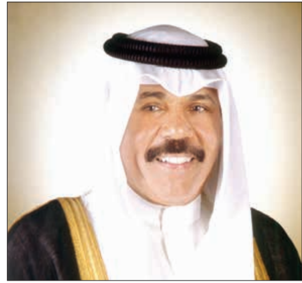
سمو ولي العهد الشيخ نواف الأحمد

الرخاء ويوفق الجميع لخدمته ورفع رايته وبيبارك بكل الجهود الرامية للارتقاء بكل مقوماته وتحقيق المزيد مما ننشده له من تقدم وازدهار وأن يديم على سموه حفظه الله موفور الصحة وتعام العافية. كما تلقى سمو ولي العهد الشيخ نواف الأحمد برفقية تهنئة من رئيس مجلس الأمة مرزوق الغانم بمناسبة حلول عيد الأضحى المبارك ضمنها باسمه ونياحة عن أعضاء مجلس الأمة أسمی عبارات التهاني والتبريكات وأصدق مشاعر الوفاء وأطيب الأمنيات، متضرعاً إلى المولى عز وجل أن يعيد هذه المناسبة المباركة وأماناً على سموه أعواماً عديدة وأزمنة مديدة وأن يمتعه بوافر الصحة وتعام العافية وأن يؤيده بالنعون من لدنه والتوفيق لكل ما فيه رغبة وسؤدد ورفق ووطننا الحبيب. وقد بعث سمو ولي العهد الشيخ نواف الأحمد برفقية