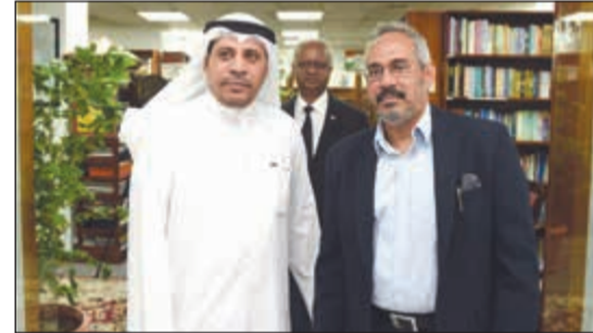
نائب مساعد وزير الخارجية لشؤون آسيا السفير سالم الحمادان يقدم التعازي