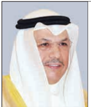
الشيخ خالد الجراح

بعث سمو ولي العهد الشيخ نواف الأحمد برفقية تهنئة إلى صاحب السمو الأمير الشيخ صباح الأحمد عبر فيها سموه عن خالص التهاني وأسмі الأمانی بمناسبة حلول عيد الأضحى المبارك، مبتهلاً إلى المولى في علبائه أن يعيد هذه المناسبة المباركة على سموه وعلى شعبنا الوفي والأمتين العربية والإسلامية بوافر الخير واليمن والبركات. كما أعرب سموه عن بالغ الاعتزاز بالقيادة الحكيمة والمسيرة الوطنية والروية الفارقة لسموه مختتماً هذه الأيام المباركة، داعياً المولى سبحانه أن يحفظ سموه ذخراً لوطننا الحبيب لاستكمال مسيرة نهضته وبنائه رفعا راية عزه ومجده وأن يسبغ على سموه موفور الصحة والعافية وأن يديم على وطننا الغالي الأمن والأمان والمزيد من التقدم والرخاء في ظل القيادة الحكيمة لراعي نهضتنا ومسيرتنا