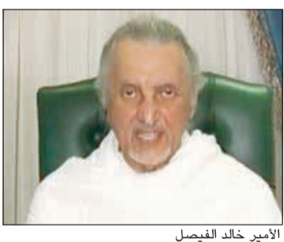
الأمير خالد الفيصل

وأوصى بتقوى الله والاستجابة لأوامره، وشدد على أن طاعة ولاية الأمور لها أثر عظيم في حفظ النظام العام، داعيا إلى اعتماد المعايير الأخلاقية في شتى مجالات الحياة. من جهته، قال الأمير خالد الفيصل إن هناك إصرارا من صاحب السمو الملكي الأمير محمد بن سلمان ولي العهد نائب رئيس مجلس الوزراء «سمعته شخصيا لتطوير المشاعر المقدسة ومكة المكرمة لتكون من أرقى وأذكى مدن العالم». ودعا الفيصل في تصريح تلفزيوني رجال