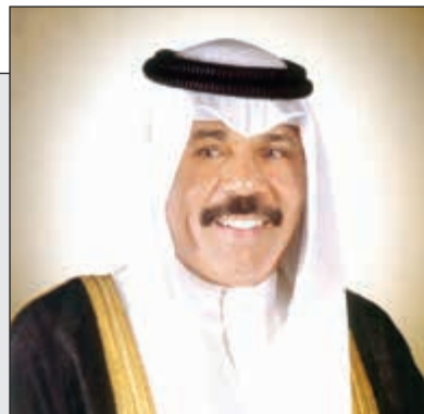
سمو ولي العهد الشيخ نواف الأحمد