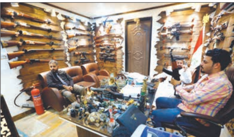
عراقي يبيع أسلحة اتوماتيكية في بغداد

وهنا يرى محللون أن تصريحات حيدر العبادي الخاصة بموقف العراق من العقوبات الأميركية عتية الـ 165. غير أن المكونات السنية والكردية التي تعاني من التشرذم بذاتها لم تحضر الاجتماع الذي تخلله هذا الإعلان. لكن ذلك أصبح أكثر صعوبة مع مفاجأة البيان الصادر عن مستشار الأمن الوطني (الأمين العام لـ «حركة عطاء») فالح الفيض،