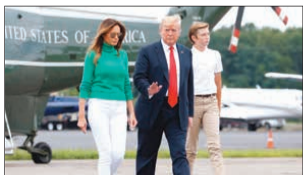
الرئيس الأميركي دونالد ترامب وزوجته ميلانيا وابنهما لدى وصولهم نيويورك على متن طائرة رئاسية أمس الأول

عواصم - وكالات: قال الرئيس الأميركي دونالد ترامب مازحا انه لا يستبعد وصول رئيس وزراء مسلم إلى رئاسة حكومة إسرائيل في حال تسوية القضية الفلسطينية بإقامة دولة واحدة وانتهاء حل الدولتين. ونقل عن ترامب قوله خلال لقائه العامل الأردني الملك عبدالله الثاني بواشنطن في 25 يونيو الماضي: «في حال سيناريو الدولة الواحدة، فإن رئيس وزراء إسرائيل سيكون اسمه محمد في غضون سنوات قليلة». وذلك ردا على ما قاله العامل الأردني من ان الكثير من الشباب الفلسطينيين لم يعودوا حريصين على حل الدولتين، وإنما يفضلون العيش في دولة واحدة مع الإسرائيليين على أن يكون لديهم حقوق متساوية، بحسب ما نقلت القناة العاشرة في التلفزيون الإسرائيلي.