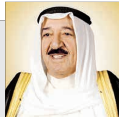
صاحب السمو الأمير الشيخ صباح الأحمد

صاحب السمو تبادل التهانى مع ولي العهد بالعهد: ليحفظ الله وطننا الغالي ويدم عليه نعمة الأمن والأمان والرخاء ويوفق الجميع لخدمته ورفع رايته 02 و03