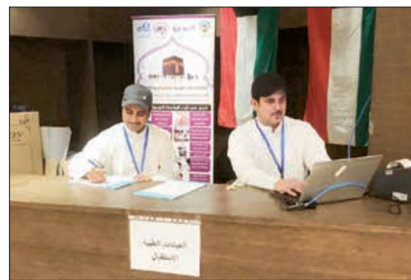
قسم الاستقبال في عيادة الفريق الطبي