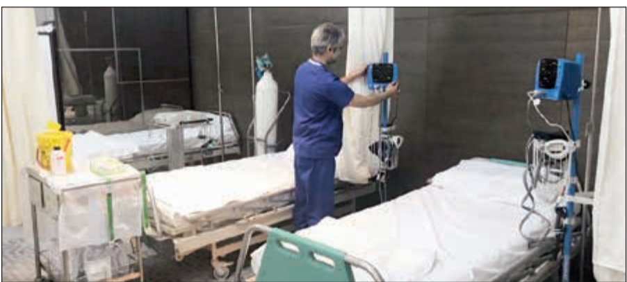
غرفة الملاحظة في إحدى العيادات