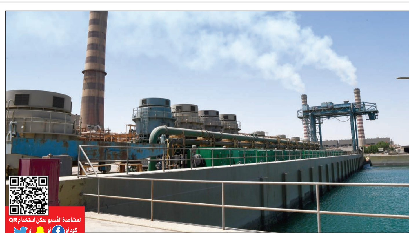
محطة «الدوحة الشرقية» تنتظر تطوير وحداتها أو استبدالها