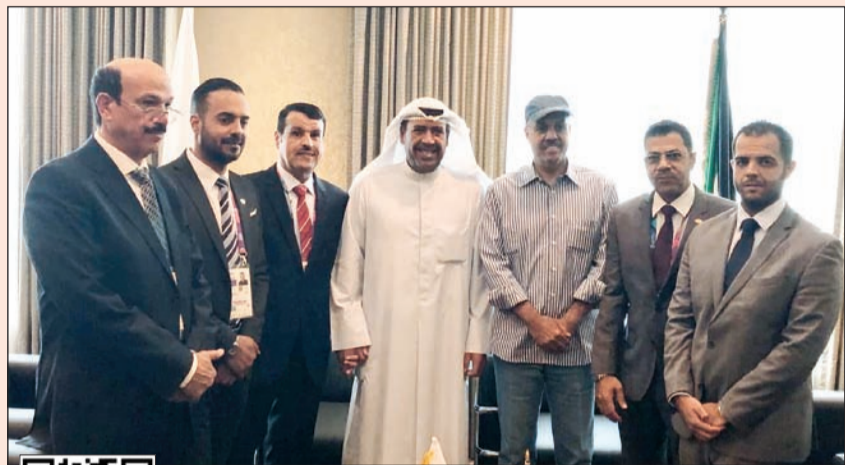
الشيخ أحمد الفهد والشيخ أحمد النواف في جاكرتا