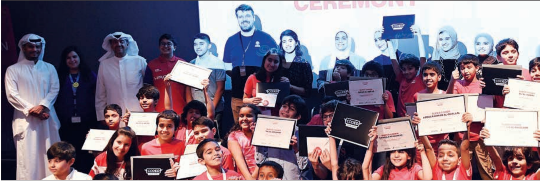
الخشتي ومسؤولو «زين» مع الأطفال خلال حفل الختام

وتزويدهم بالمهارات الحديثة اللازمة لتجريب الإبداع التكنولوجي في نفوسهم